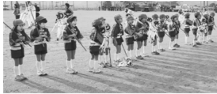
寒さに体を震わせる幼年消防クラブの子どもたち

開会式終了後、幼年消防クラブの通常点検が披露され、引き続き消防団による通常点検・操法競技・放水競技が行