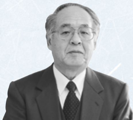
教育長 西浦 弘

平成18年の輝かしい新春を迎えられた村民の皆様にご心からおよろこび申し上げます。昨年は暗いニュースが日本中を覆い、人間としての倫理が問われた年でもあった。「赤信号みんなで渡れば怖くない」という流行語がその後も各業界で脈々として生き続けていたことを耐震強度偽造が如実に物語った事件は国民に大きな衝撃を与えた。そこには、安全安心も信頼もなく、ただ金だけの世界しか存在しない、本当に寒々とした世の中になってしまったよう