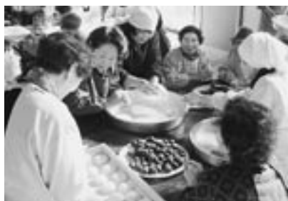
慣れた手つきで、あっという間に出来上がりました。

餅をつき、女性がもちを丸める作業を分担し、終始笑顔で餅つき会を楽しみました。 出来上がった餅は参加できなかつた、ひとり暮らしの人へも配られました。