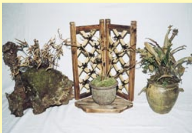
左から岩オモダカ・ヤシャビシャク・ヒトツバ