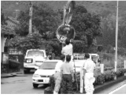
ピカピカになりました

汚れてくすんでいたカーブミラーは、一基ずつ丁寧に磨かれ、道路の状況がはっきり見えるようになりました。ドライバーの皆さん、きれいなになったカーブミラーを良く見て、安全運転に心がけましょう。