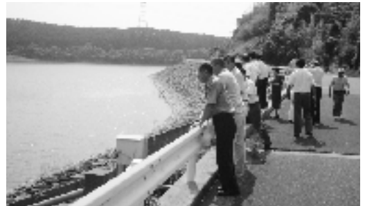
5ヶ所の調整池で一番大きい後川内ダム湖 （周囲約1.5km）