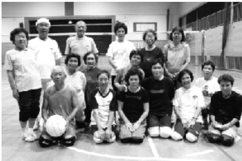
6月27日に練習されたみなさんです。