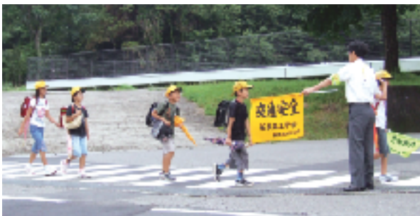
校長先生が横断旗を持って安全確保

また、当技術研究会では、6月25日（日）に子供たちが安全に通学できるように、国道と広域農道の交差点付近の歩道の除草作業が、ボランティアで実施されました。