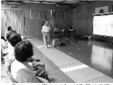
スクリーンの車のスピードを見て歩行

ら45名が参加して行われました。実際に道路を横断するときに、どのくらい時間がかかるのかを機械を使って数名が計測し、速い人は約4秒遅くて9秒かかりました。その計測を元に、スクリーンを見ながら事故にならないための、横断の方法についての指導を受けました。