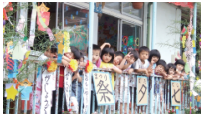
七夕祭で記念撮影！

「おもいやり」「がんばり」「がつしよう」のできる人という園の願いも一緒に込められたきれいな七夕飾りができました。