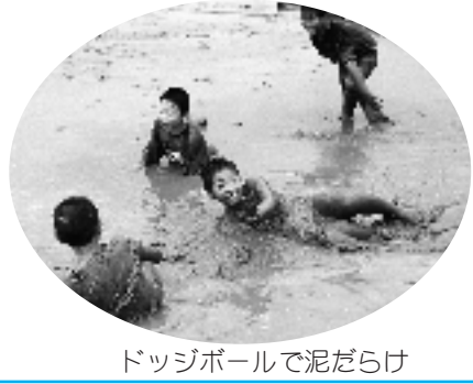
ドッジボールで泥だらけ

総合的な学習時間に米作りの体験を通して土とふれあって、親しみを感じられたらと、今年は、体験後に田んぼの中のドッジボールを楽しみました。始めは、田んぼの中に足を入れるのもやっとの様子でしたが、次第に慣れ、ドッジボールになるとみんな泥まみれになって、ボールを追ったり、逃げたり大はしゃぎで、しまいには、泳ぎだす児童もいました。 体験終了後、教室に帰り差し入れのおにぎりとお茶をいただきました。