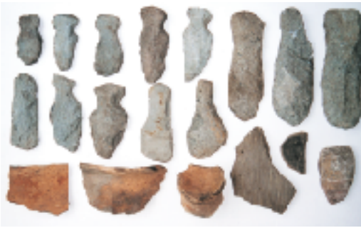
上段が縄文時代の石器、下段右端が石鍋

遺跡の名称は、立神という字名から立神遺跡として登録されました。これで、村内の遺跡は計54箇所になります。