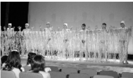
ダンス？肉體美？に会場が湧きました