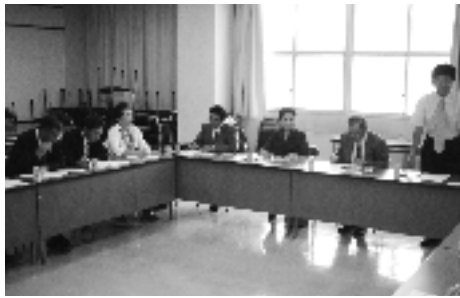
飯盛北部土地改良区事務所において理事長の説明を受ける

村民は、洪水による被害地を遊水地と思い込んでいる人が多いが実際は国土交通省が遊水地として指定しなければただの洪水常襲地帯として扱われるし、改善もしないのであり、本村としては、今後とも粘り強く国に対して川辺川の川底の掘削や堤防の嵩上げを要望していくべきと感じた。