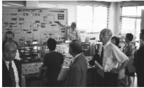
上場土地改良区における 揚水システムの説明を受ける