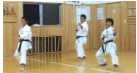
大会前の練習風景