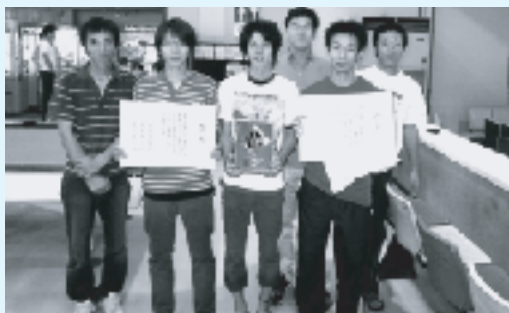
優勝したボウリング出場メンバー