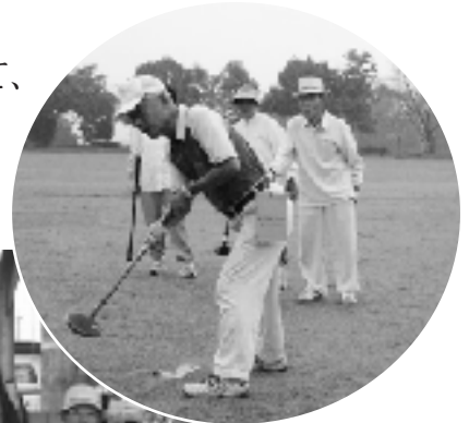
赤=ルインワン連発!!