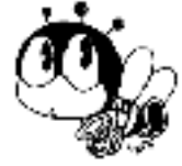
生涯学習マスコット「マ」さん