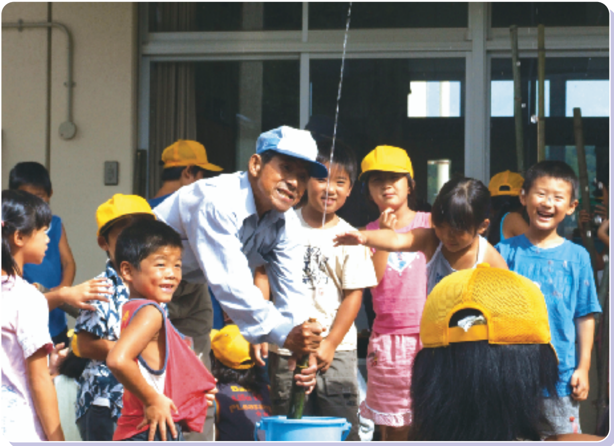
「サガラッパ塾」で水鉄砲製作。(協力：松葉老人クラブ)