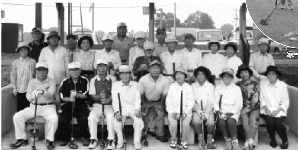
撮影の日には雨でしたが、少々の雨はおかまいなしで、みなさん元気にプレーを楽しまれていました。 (9月13日撮影)