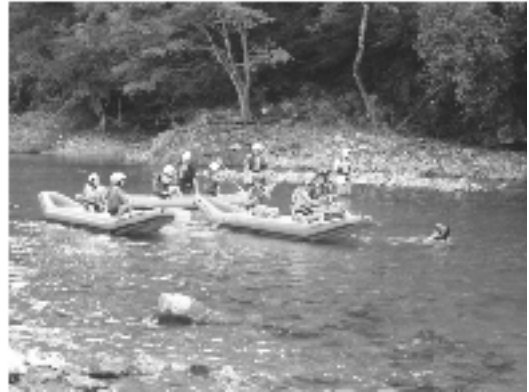
楽しかったカヌー体験

ふるさと学級は、私にとってとてもいい思い出になりました。学んだことをこれから生かせるように頑張りたいです。また、こういう機会があれば、自分のためにもぜひ参加したいなと思います。