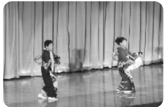
さわらび会の舞踊