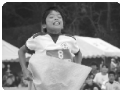
みのむしコロリン