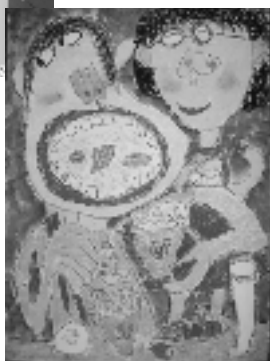
作品名「もりもり食べよう」

熊本社会保険事務局では、小中学生の年金に対する関心を促進することを目的として、「こくみんねんきんイメージコンクール」を実施し、相良中学校から「中学生はがき部門」に応募され、下記のとおり見事入賞されました。