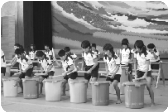
南小学校6年生のバケツ太鼓