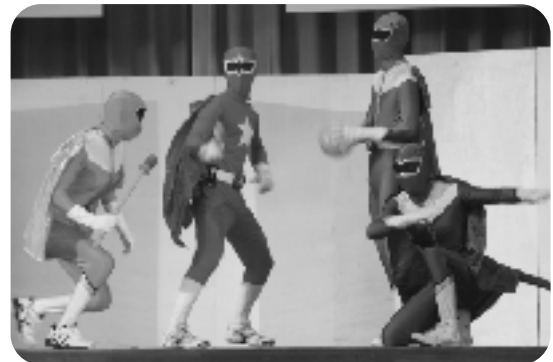
青年団のヒーローショー