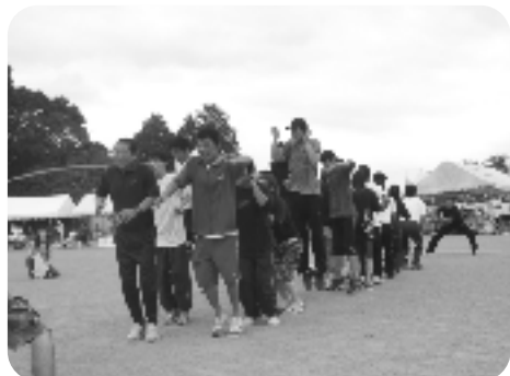
みんなでジャンプ