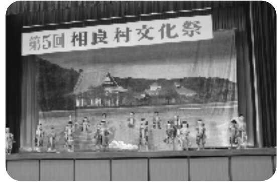
暁保育園の舞踊劇