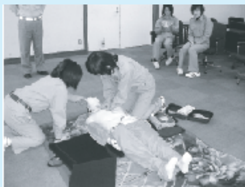
心肺蘇生法とAEDを使用した救命処置

相良村消防団女性消防隊は、平成20年2月16日（土）、人吉下球磨消防本部において、普通救命講習を受講しました。応急手当・救命処置等の重要性を学びその後、人形を使用した実技講習では、心肺蘇生法と自動体外式除細動器(AED)の救命処置を習得しました。