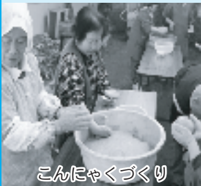
こんにゃくづくり