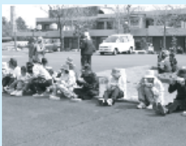
あったかいぜんざいは大人気

ぜんざいの後は、お楽しみ抽選会があり、ウォーキングにちなんだ豪華景品がプレゼントされました。