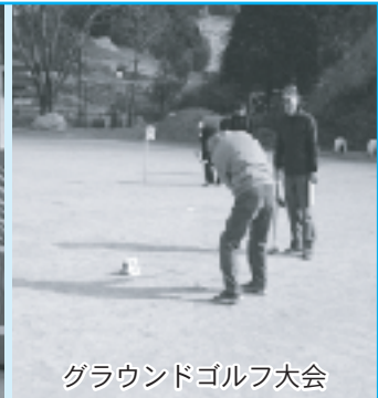
グラウンドゴルフ大会