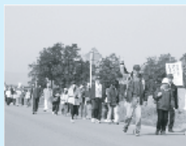
みんな笑顔でウォーキング