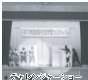
チャレンジャーショー

その後、再び会場を生涯学習センターに移して、今回のメインイベントである「民話の語り～さがらの里の物語～」が開催されました。