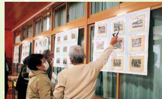
卒業記念写真を見て当時を懐かしむ地域の方々