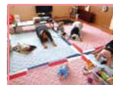
ママボディーワーク