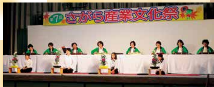
大正琴愛好会と相良いけばな教室