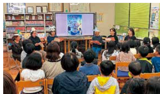
「どんぐりの会」の朗読を聞き入る児童たち

相良南小学校の図書室で、午後7時から相良村読み聞かせボランティア「どんぐりの会」主催の夜の読み聞かせ会が行われ、およそ50人の親子が参加しました。本に親しみを持ってもらえるよう、また、読み聞かせを通じて心の栄養を届けたいという思いで活動されています。