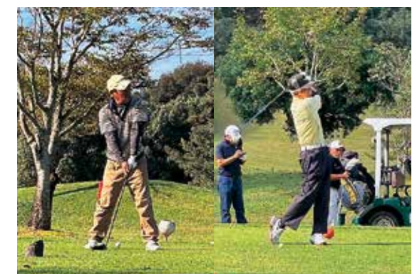
天気にも恵まれプレーを楽しむ相良チームの選手たち

球磨郡民体育祭の最終競技のゴルフ競技が、10月25日(土)あさぎり町の熊本クラウンゴルフクラブで行われ、本村から5チーム(18人)が出場しました。