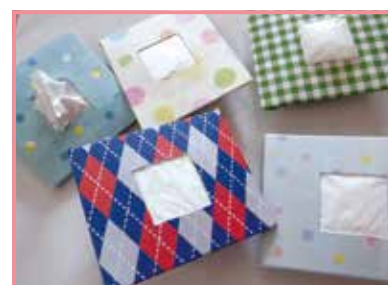
おむつ袋収納ケース作り

そのほか、赤ちゃんたちの寝相アートやママヨガなども楽しみました!12月も楽しい企画をご用意していますので、気軽に遊びにきてください♪