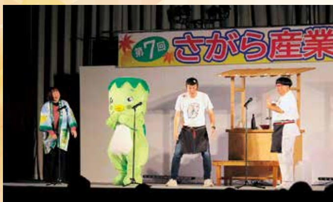
九州新喜劇にはサガラッパ君も出演！