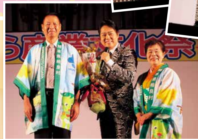
村の特産品と花束の贈呈