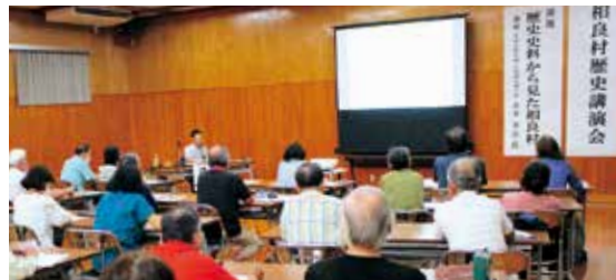
永井氏の解説を熱心に聞き入る参加者たち

そして、心肺蘇生法の演習では適切な深さ・速さの難しさやとても体力を使うということに驚かされていました。