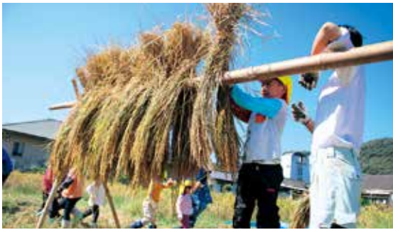
刈り取った稲を丁寧に竿掛けする園児

なつめ保育園の園児約30人が「復興米」の稲刈りと竿掛け体験を行いました。この「復興米」は、兵庫県の社団法人神戸国際支援機構（岩村義雄会長）の支援を受けて、園児たちが今年の6月に田植えを行ったものです。