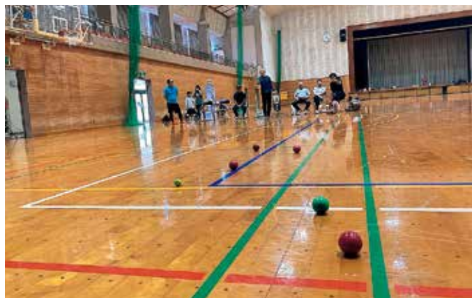
目標となる黄色い球に狙いを定めてボールを投げ合うペタンク競技