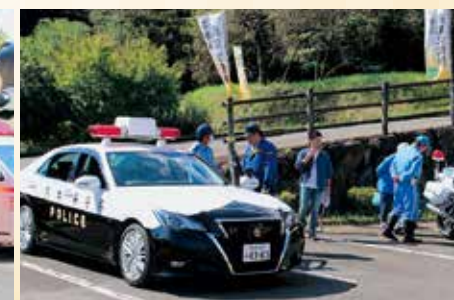
消防・警察・自衛隊による車両展示