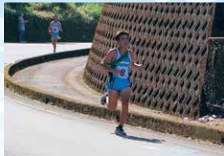
男子5区ラストスパート!