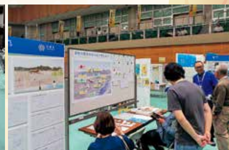
廻り交流拠点施設名称募集