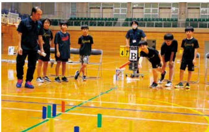
数字が書かれたピンを倒し得点を競い合うモルック競技

参加者からは、「すごく面白くてあっという間の時間だった」「またやってみたい」「大会を開催してほしい」などの感想が聞かれました。