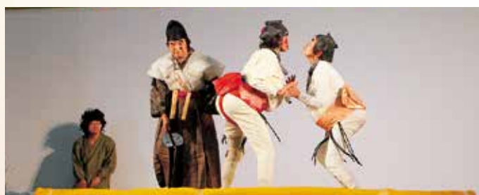
深水女相撲保存会