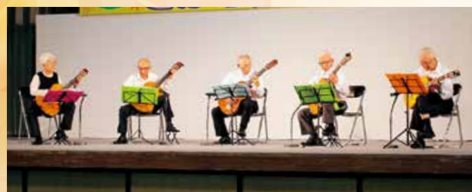
クローバーロマンティックス