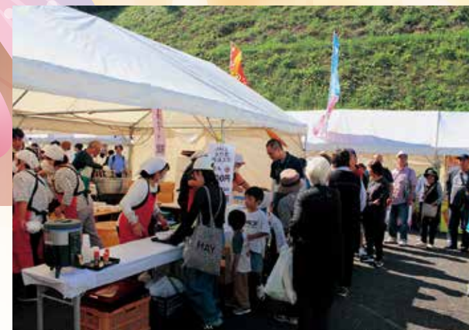
昼時のうどんコーナーには長蛇の列