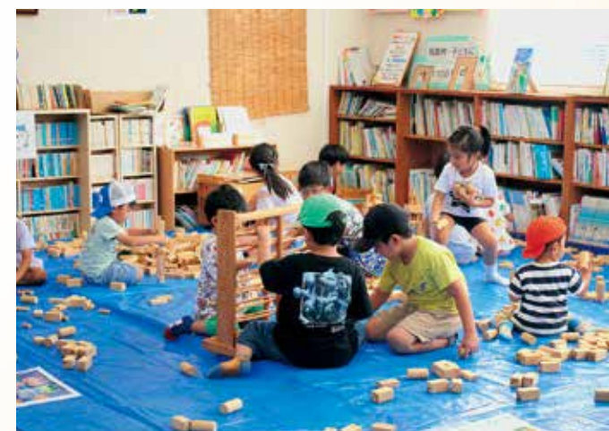
相良村森林組合による木育活動