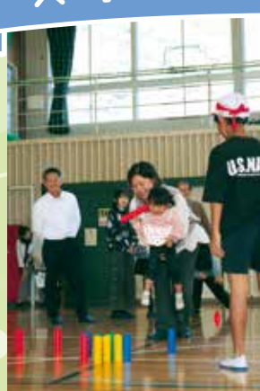
大盛り上がりでのモルック大会