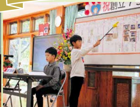
自分たちで作った年表を使って北小の歴史を発表