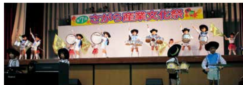
なつめ保育園鼓隊