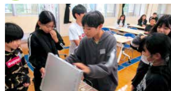
1億円のレプリカを眺める児童たち

相良南小学校で租税教室が行われ、6年生が参加。租税に関する意義や役割などを正しく理解してもらい、税に対する理解が広まることを目的に行われました。