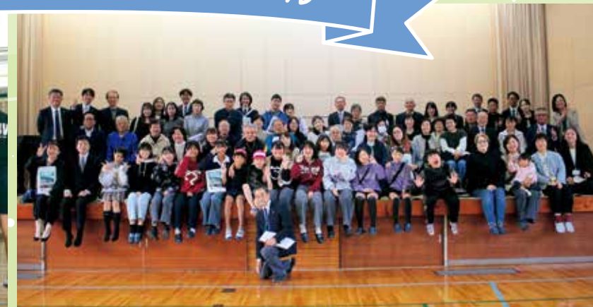
参加者で記念撮影