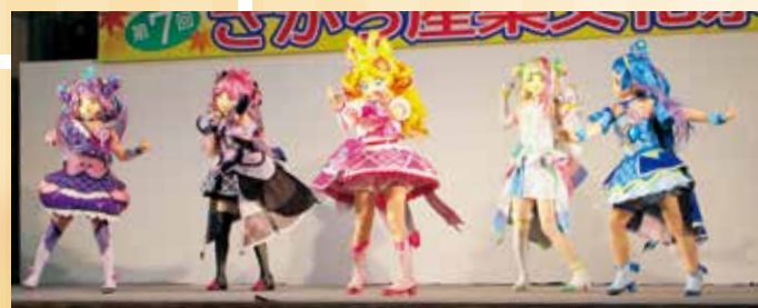
キャラクターショー「キミとアイドルプリキュア」