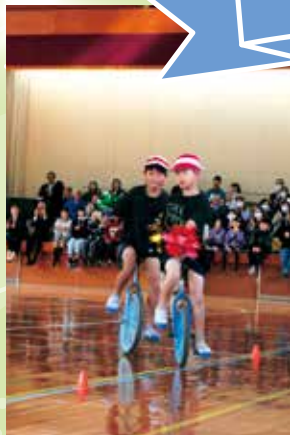
練習を重ねてきた一輪車の発表