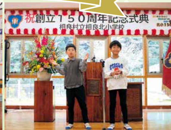
手拍子や歌(言葉)で楽しく演奏