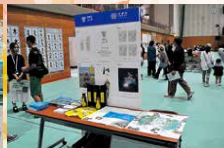
さがらムーブブース