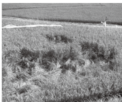
イノシシによる水稻被害

相良村では、農作物等の鳥獣被害を防止するため、相良村有害鳥獣捕獲隊に駆除の依頼をしています。捕獲隊の皆さんには、お忙しい中ボランティアで協力していただいております。夏の暑い日にも目撃情報があった場所につけ、農作物等の被害防止のために駆除活動に取り組んでおられます。そのような中で、「農作業の邪魔になるから入っ