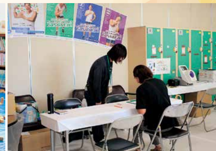
健康相談コーナー