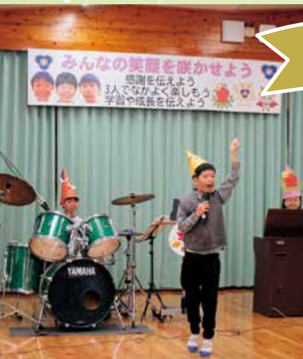
児童と職員による合奏