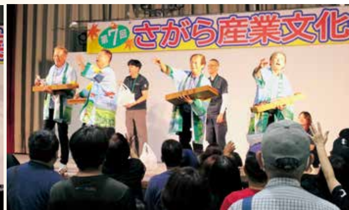
実行委員会による餅投げ大会