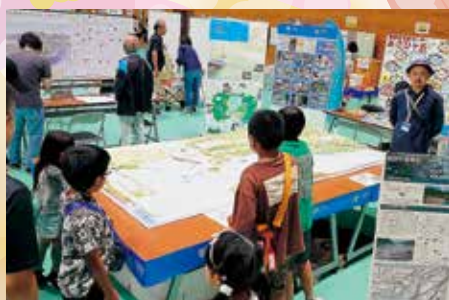
廻り交流拠点施設模型展示