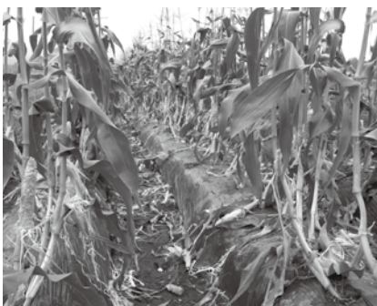
サルによるトウモロコシ被害