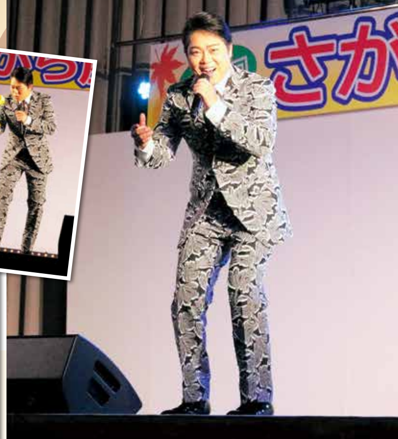
メインショー「三山ひろし」歌謡ショー