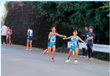
女子1区から2区へのたすき渡し

10月10日(金)、あさぎり中学校を発着点に球磨人吉中体連駅伝大会が開催され、相良中学校が女子の部で7位、男子の部では9位と力走しました。