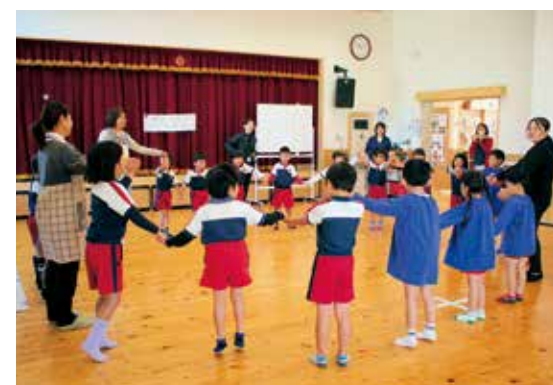
レクリエーション「おたんじょうびなかま」

なつめ保育園・暁保育園の年長児たち23人の交流会がなつめ保育園にて行われました。昨年までは3園での交流会を行っていましたが、あざみ園の閉園に伴い今年から2園での交流会となりました。まずは、自己紹介タイムからスタート。緊張しながらも名前を大きな声で伝えることができました。その後は、ホールでレクリエーションや園庭では玉入れやおにごっこ、ドッジボールなどを楽しみました。園児たち「最初は緊張したけど楽しかった」と話しました。