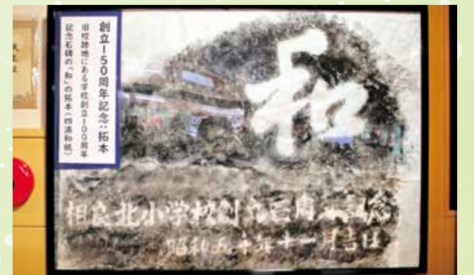
創立100周年記念石碑から取った「和」の拓本