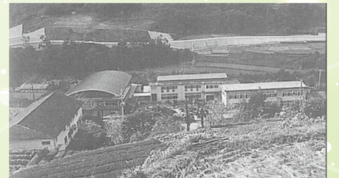
昭和50年頃の校舎(田代新校舎)