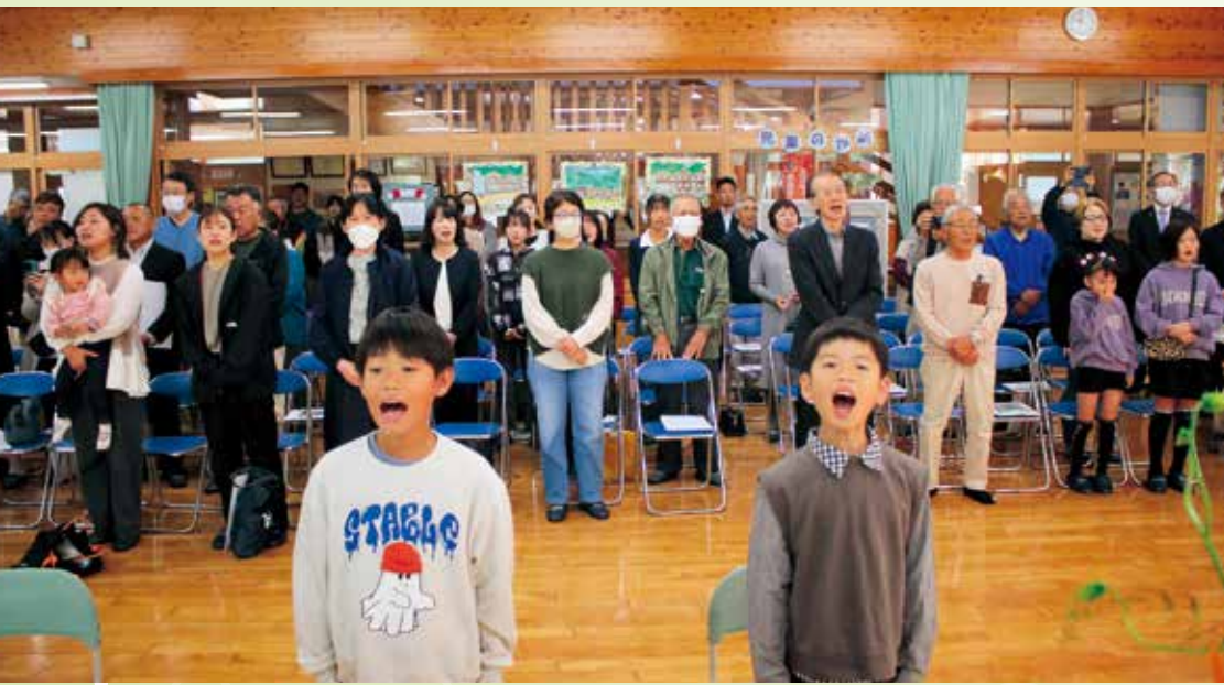
参加者全員で校歌斉唱