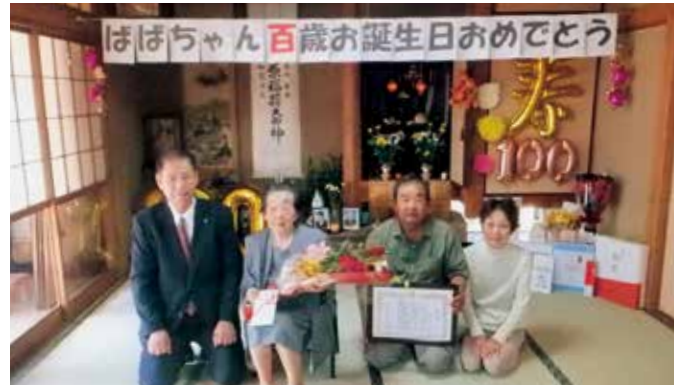
息子さんご夫婦と一緒に自宅で1枚

参加者は「十島菅原神社の水盤に約170年前に起こった地震の記録が刻まれていたことを初めて知った」「古民家の解体で発見された太鼓踊りの絵に驚かされた」など、終始、歴史史料についての解説を熱心に聞き大変満足された様子でした。