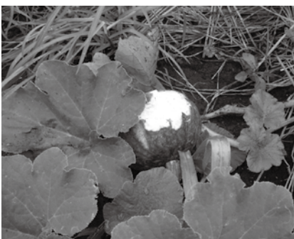
サルによるカボチャ被害