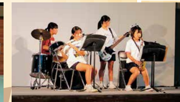
相良中学校バンド風アンサンブル