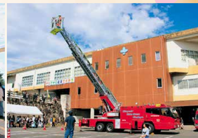
はしご車搭乗体験