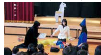
なつめ保育園（10月30日）