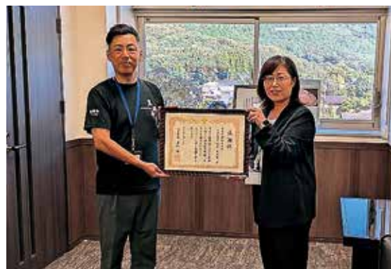
感謝状を受け取る杉本代表取締役(左)