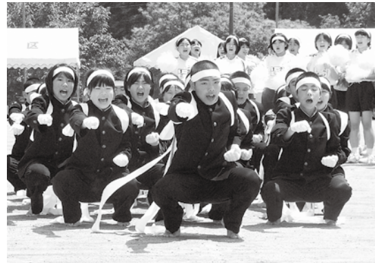
応援競演の様子（白団）