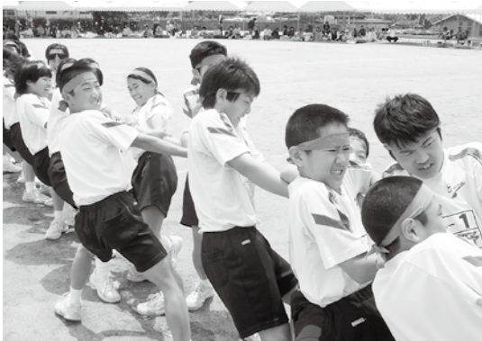
引け！引け！飛雄馬、ドンと引け！

今年、『仲間と共に 勝利に挑め！！』～つかみとれ 大きな感動～をスローガンに、赤団、白団対抗のリレーや大綱引き、生徒全員が一致団結した組体操や全校ダンスなど、短時間で精一杯練習した成果を発揮していました。