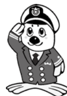
当庁イメージキャラクター 「うみまる」

なお、受験資格、受験手続等の詳細は、海上保安庁ホームページをご覧ください。 か、第十管区海上保安本部までお問い合わせください。