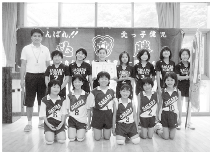
優勝を飾った相良北小バレーボール部

と戦い、決勝トーナメントの準々決勝では須恵小、準決勝では東間小Aチーム、注目の決勝戦では人吉東小との戦いでした。いずれも2-0で勝利。日々の練習の成果を出し切ってチーム一丸となって戦い、念願の優勝を果たしました。