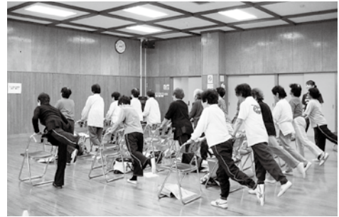
筋肉筋力トレーニングの様子です。