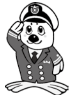
当庁イメージ キャラクター 「つみまる」

〒890-8510 鹿児島市東郡元町4番1号 鹿児島第2地方合同庁舎5階 第十管区海上保安本部 総務部人事課 ☎099-250-9800 FAX099-250-9850