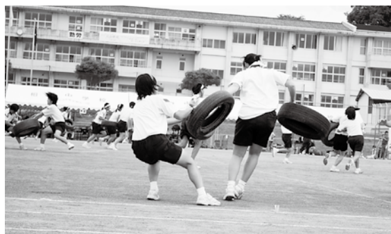
「Are you タイヤ～ド?」

途中は小雨が降ることもありましたが、生徒らも雨に負けずに競技を続け、全種目を無事に実施できました。結果は白団が総合優勝。大きな歓声が沸き上がっていました。