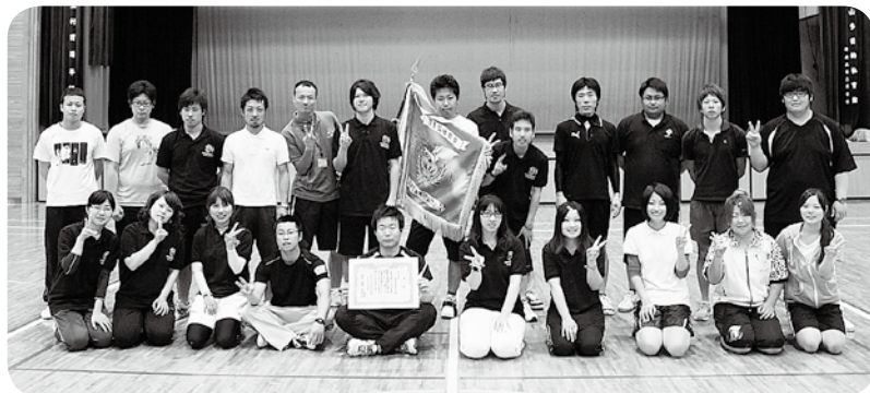
見事優勝を勝ち取った相良村青年団の皆さん

球磨郡青年団協議会の第39回体育祭が5月29日、あさぎり町深田の高山体育館で開催され、相良村青年団が7年ぶりに優勝を果たしました。