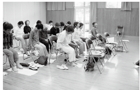
“タオルギャザー”に四苦八苦中です。