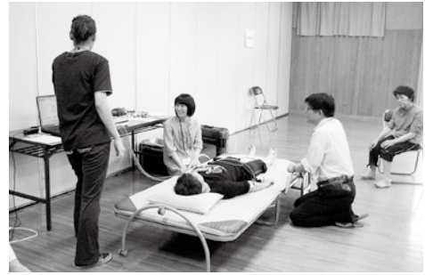
フィジヨンで“体組成測定”を実施中です。