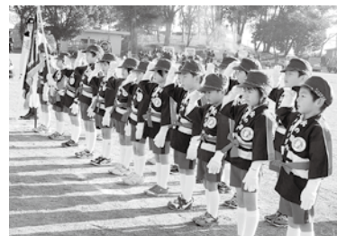
保育園児による演技