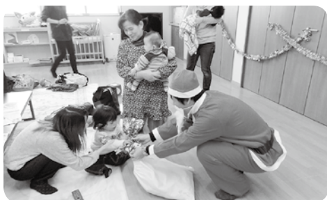
12月ちゃちゃクラブの様子