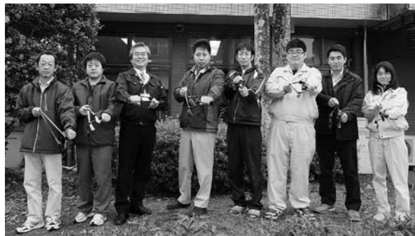
鳥獣被害対策実施隊メンバー

主な活動としては、被害状況の調査、有害鳥獣の追払い、また駆除隊と連携しながらワナの設置等を行います。