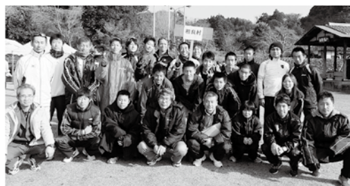
選手・補員・監督の皆さん