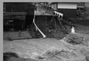
梅雨前線豪雨 (平成19年7月)

梅雨前線による豪雨で河川が氾濫した豪雨災害。美里町では道路寸断、土砂崩れで集落が孤立した。