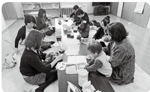
1月ちゃちゃクラブの様子