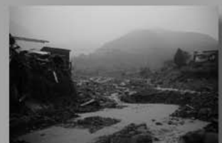
県南集中豪雨 (平成15年7月)

九州の広範囲を襲った集中豪雨。水俣市では大規模な土石流が民家を直撃。19人が犠牲になった。