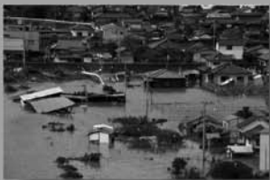
県内全土が大きな被害を受けた台風災害。宇城市(旧不知火町)では、高潮で 12 人が犠牲になった。