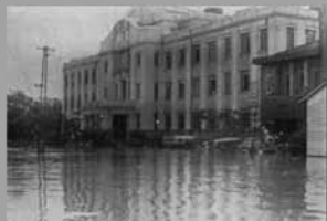
県北中部を中心に発生した集中豪雨。死者・行方不明者は 500 人超、家屋全壊は 1,000 戸を超えた大水害。