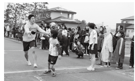
タスキをつなぐ下四浦の選手