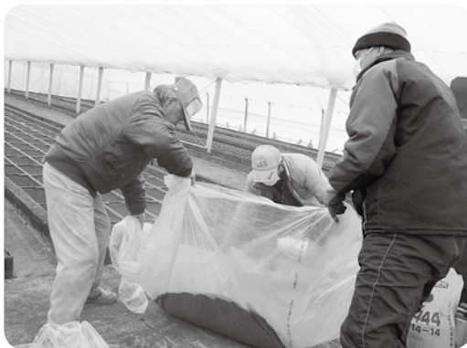
種と焼土の混ぜ合わせ作業の様子