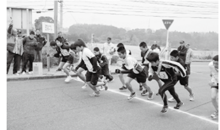
一齐にスタートする1区の選手