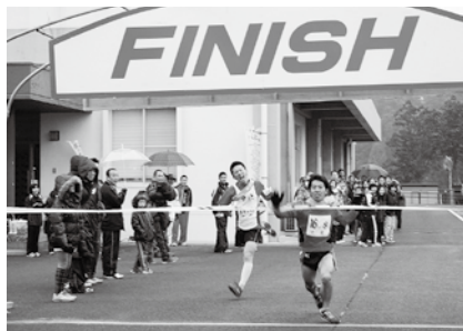
中央区と十島区のゴールの瞬間