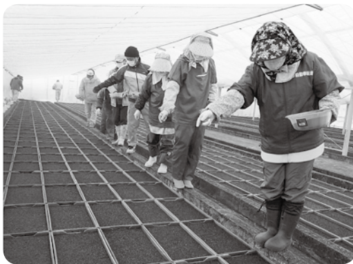
種まき作業の様子