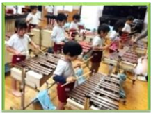
本物に触れて 感性を豊かに

『身近処理の出来る子供』 すべての基本となる「生活リズム（食・排泄）」気持ちや活動の土台づくり 『元気な子供』 健やかに心と体を育む環境づくりとプログラムの工夫、実践 『自分で考える子供』 楽しむときも、困った時も、自分で考える機会をもつゆとり 『仲の良い子供』 自分自身を大切にするために、友達との関わりで心を耕す機会づくり 専門の保育士が、年齢に応じたカリキュラムを元に季節感や地域の環境を生かした様々な体験の場を設定し、毎日楽しく過ごせる工夫をしています。