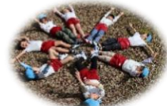
様々な素材に触れ、感触の違いを楽しむ活動！

園庭にある“ふれあいひろば”…自然に囲まれ、穏やかな場所で伸び伸び遊びまわると！