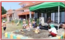
広い園庭でのびのび遊びこむ！！