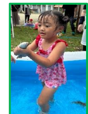
ヤマメのつかみ取り体験