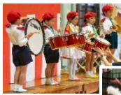
運動会では、 鼓隊も披露！