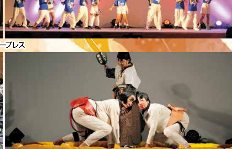
深水女相撲保存会