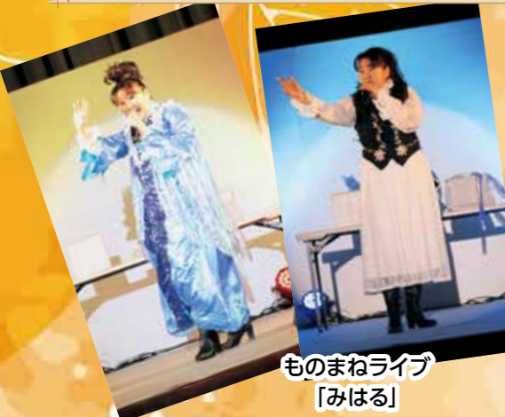
ものまねライブ 「みはる」