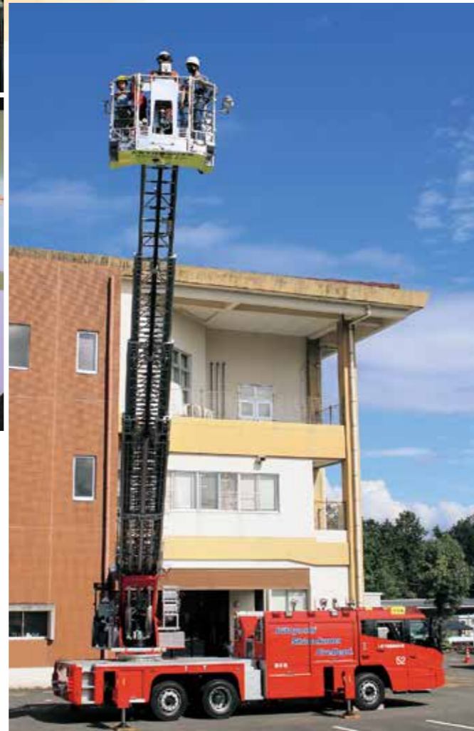
はしご車搭乗体験