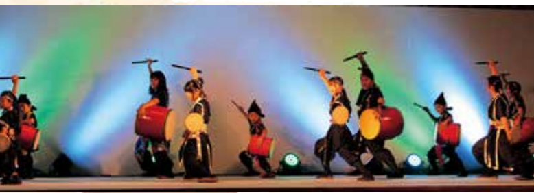
創作エイサー団体「慈琉」