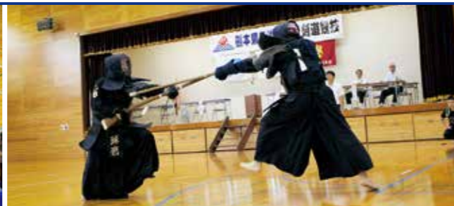
銃剣道の試合の様子