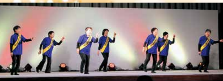
婦人会 飲酒運転撲滅音頭