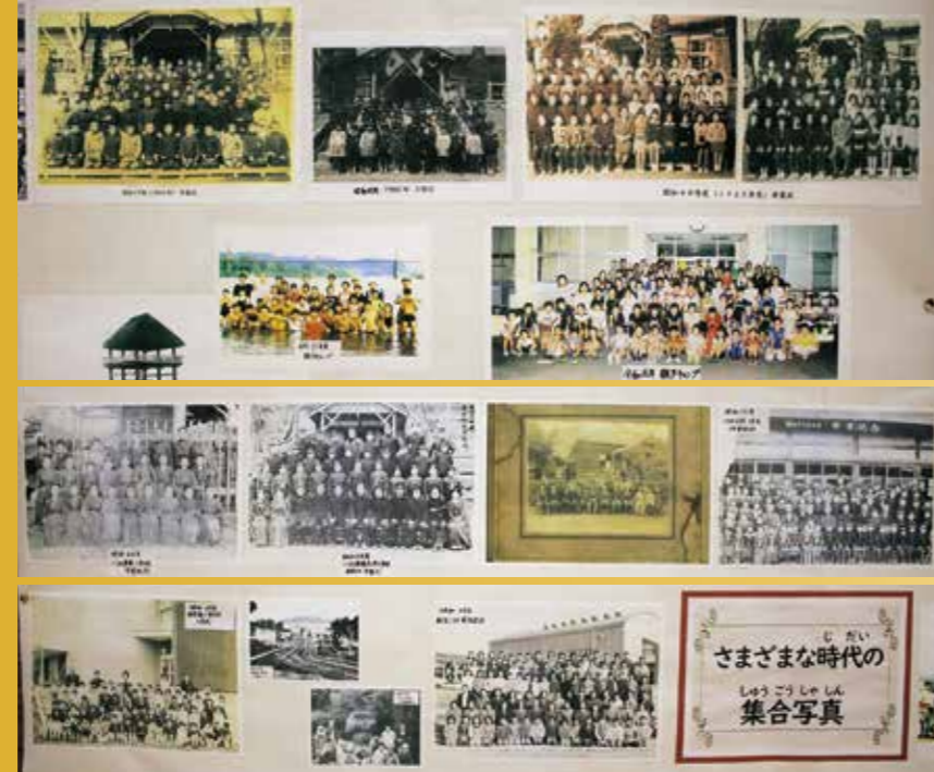
さまざまな時代の集合写真