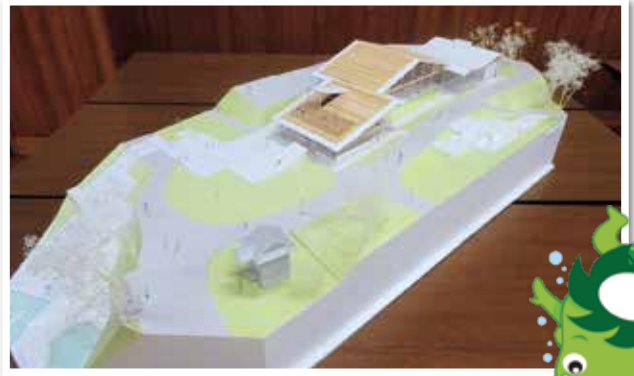
決定した作品の模型