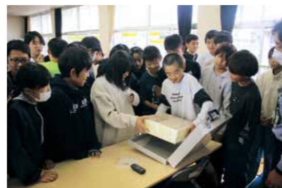
1億円のレプリカを眺める児童たち

租税に関する意義や役割などを正しく理解してもらい、税に対する理解が広まることを目的に、相良南小6年生を対象とした租税教室が開催されました。