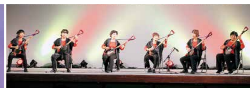
JA女性部スコッパーズ相良