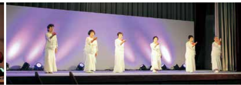
球磨・人吉手話ダンス