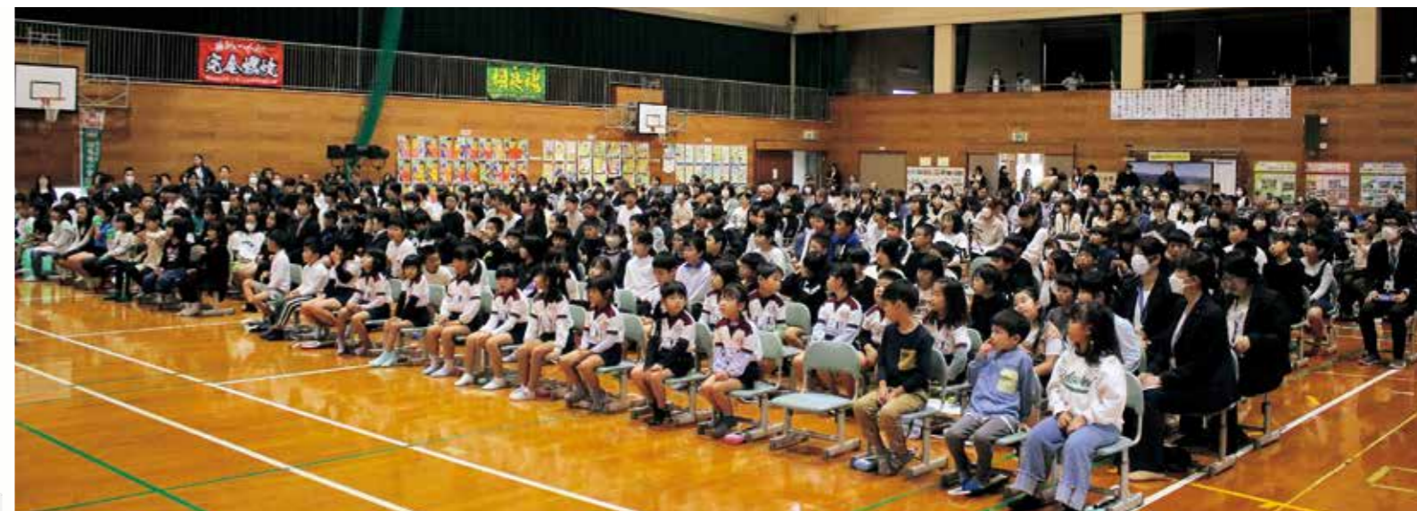
緊張した様子の児童たち

相良南小学校 150年の歴史 明治7 古見院（川辺）を仮校舎に授業開始 明治8 柳瀬校の前身校が創立 明治11 松馬場小学校が創立 明治19 第五十番小学校が三石小学校となる 明治25 三石小学校が柳瀬小学校へ改称 明治38 柳瀬小学校を柳瀬尋常高等小学校へ改称 大正4 川辺小学校を川辺尋常高等小学校へ改称 大正7 両小学校を合併し、川村尋常高等小学校と改称（両小学校に仮教室を設置） 大正11 川村大字深水の新社舎へ移転 昭和8 同時に川辺・柳瀬に分教場を置く 昭和11 勅令により川村国民学校となる 昭和16 川辺分校台風により全壊。本校に通学する 昭和19 川村小学校と改称 昭和22 柳瀬・川辺両分校を設置 昭和23 川村小学校を相良南小学校と改称 昭和31 創立100周年記念式典 昭和49 新校舎が完成 昭和62 共同調理場が完成 昭和63 体育館が竣工 平成元 川辺分校・柳瀬分校が廃校 平成9 校訓を制定 平成15 「やさしく、かしこく、たくましく」 平成31 スクールバス運行が開始 令和2 給食共同調理場が完成 令和6 7月豪雨による臨時休業 令和6 創立150周年記念式典