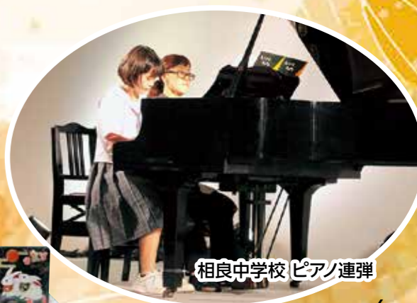
相良中学校 ピアノ連弾