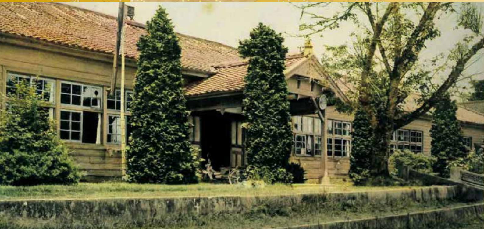
平昭和 40 年度 相良村立相良南小学校 第一校舎