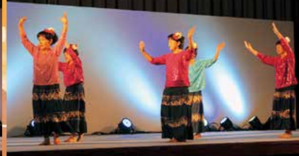
JA女性部レクレーションダンス