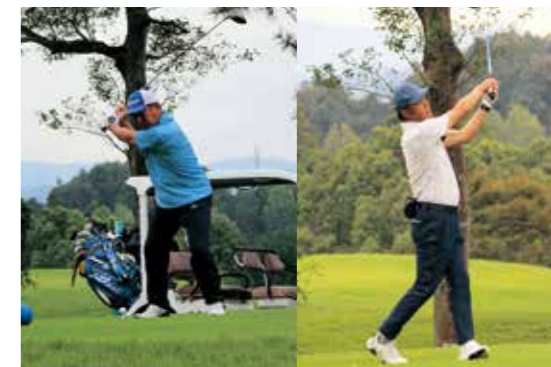
球磨カントリー倶楽部で行われたゴルフ競技の様子

球磨郡民体育祭の最終競技のゴルフ競技が、9月28日（土）錦町の球磨カントリー倶楽部で行われ、本村から5チーム（19人）が出場しました。