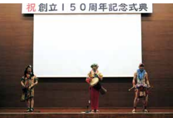
やうちブラザーズ