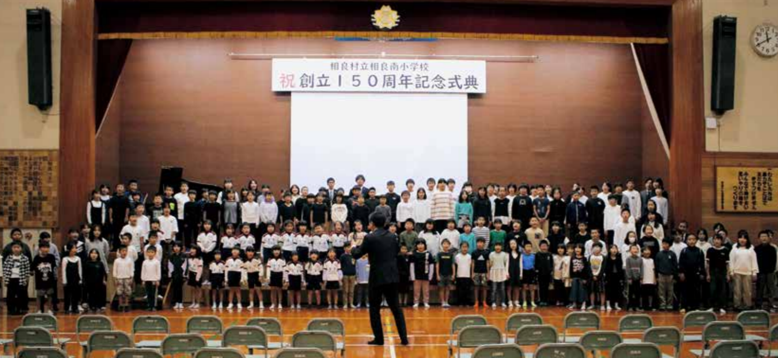
全校児童・職員による合唱