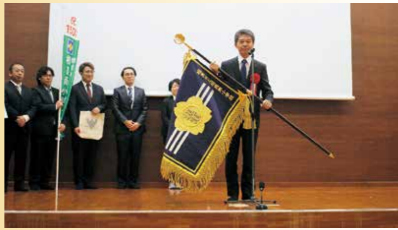
実行委員会から新しい校旗を贈呈