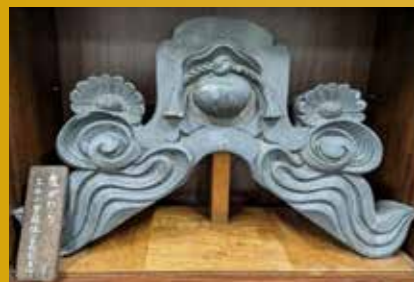
三石小学校 校舎の鬼瓦