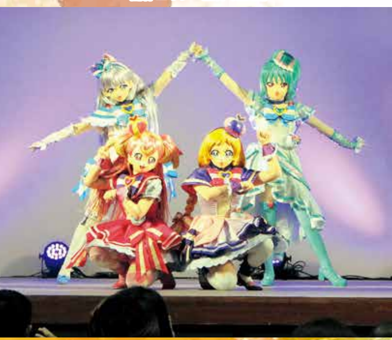
キャラクターショー「わんだふるぷりきゅあ!!」