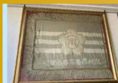
川村尋常高等小学校 校旗