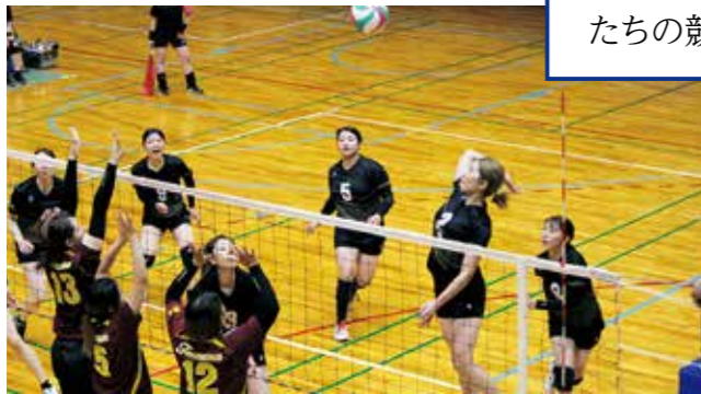
女子バレーボールの試合の様子

第79回県民体育祭が天草地域で9月14日・15日、21日・22日に開催されました。出場した相良村の選手たちの競技成績は以下のとおりです。