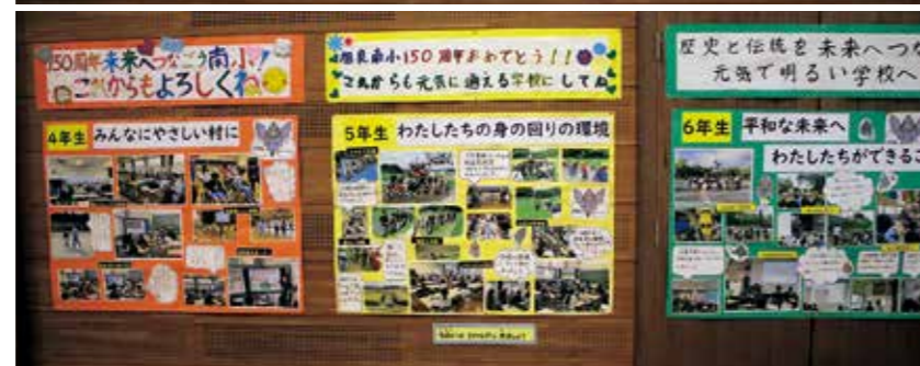
学習した内容を展示