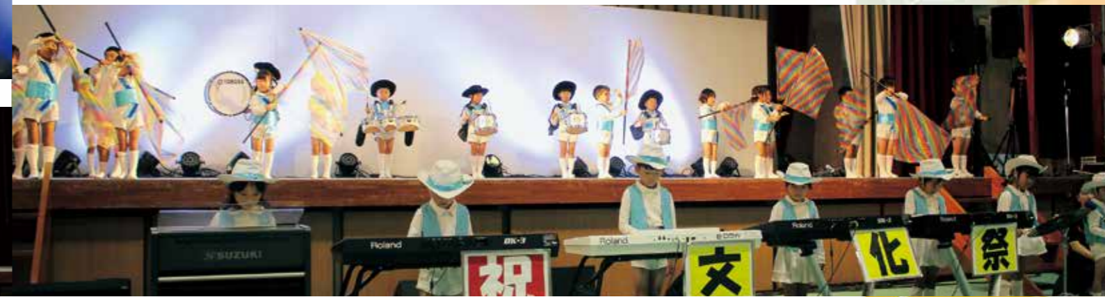
なつめ保育園 鼓隊