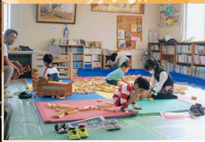
相良村森林組合による木育活動