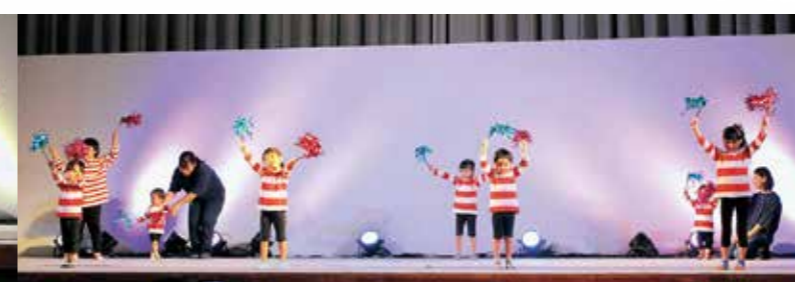
あざみ園 キッドビクス