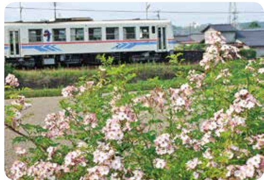
川村駅前を彩るツクシイバラ