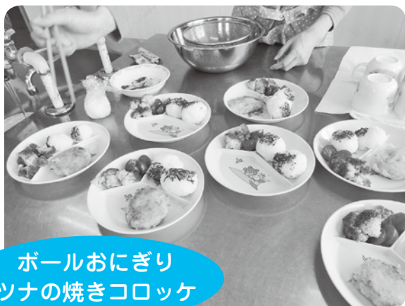
ボールおにぎり ツナの焼きコロッケ

日時：7月17日(水) 9:30より受付 場所：相良村ふれあいセンター ※準備の都合上、12日(金) までお知らせください。