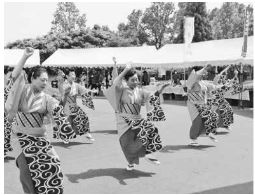
華麗なハイヤ踊り

また、相良村のキャラクター「サガラッパ」が登場すると、握手や写真撮影を求めるお客さんに囲まれ大人気でした。