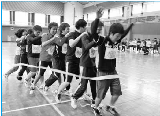
ムカデ競争 1位でゴール!