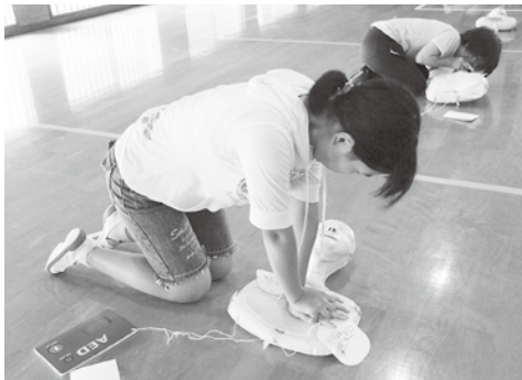
人形を使つての実習