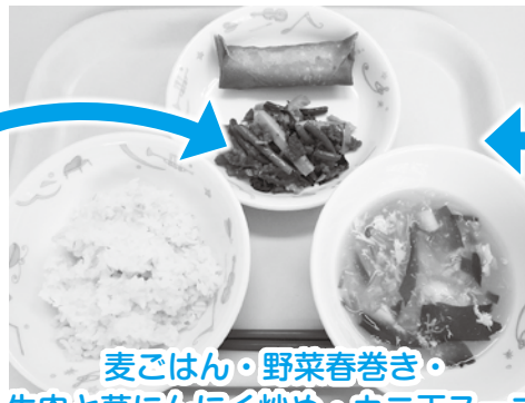
麦ごはん・野菜春巻き・牛肉と茎にんにく炒め・カニ玉スープ