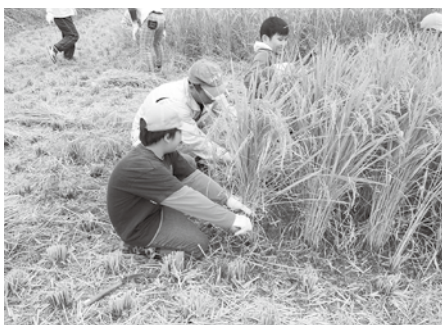
見よう見まねで鎌を使って稲を刈っていきました

10月18日、南小学校の5年生が稲刈り体験を行いました。JAくま青壮年部相良支部の皆さんの協力・指導の下、もみまき、田植え、草取りを行い、この日ようやく稲刈りまでこぎつけたということです。