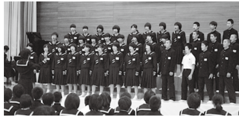
全員の息の合った合唱