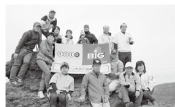
茶れんじクラブのみなさん