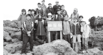
ふるさと学級のみなさん

参加者の皆さんは登山へのチャレンジ・ハイキングでたくましい体力・精神力を養い、充実した1日を送られているようでした。