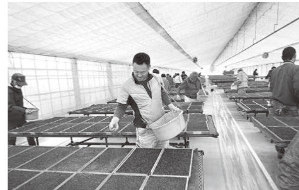
丁寧に葉たばこの種まきを行う

1月28日(日)の大安にあわせて、午前9時から錦町のJA中央育苗センターにて、豊作と作業の安全を願って葉たばこの種まきが行われました。