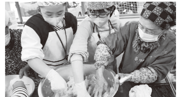
潰したこんにやく芋を手でかき混ぜる

相良北小学校では、5・6年生5人と五木東小学校の5・6年生7人との交流会を行い、四浦の伝統である四浦こんにやく作りを体験しました。交流会では、お互いの地域を紹介し、それぞれで考えたレクリエーションを楽しみました。