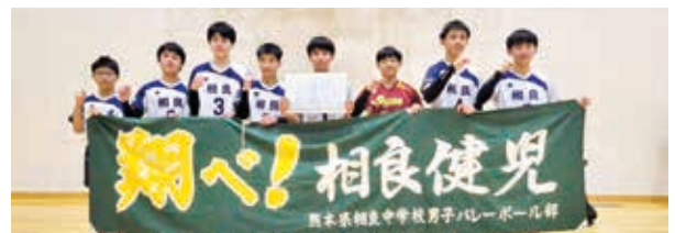
九州大会に出場する男子バレーボール部のみなさん

第46回熊本県中学新人バレーボール大会で相良中学校男子バレーボール部が準優勝を果たし、3月23日(土)から福岡県飯塚市で行われる、令和5年度京王観光カップ第41回九州中学校バレーボール選抜優勝大会に出場が決まりました。