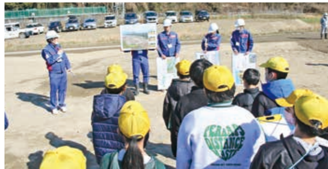
パネルを用いての説明

1月26日(金)、相良南小学校と相良北小学校の6年生41人を対象とした柳瀬地区に整備中の遊水地の見学会が行われました。国土交通省九州地方整備局八代河川国道事務所が主催となり見学会を開催。児童たちは、遊水地の機能について学習し、緑の流域治水に対する理解を深めました。