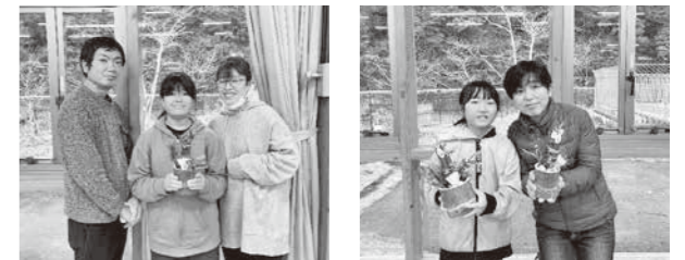
親子で協力して門松づくりを楽しむ

2学期末PTAが行われた相良北小学校では、「校内持久走大会」が実施される予定でした。しかし、この日はあいにくの雨模様だったため、「親子ミニ門松作り」に変更。地域の方々の参加もあり、賑やかにミニ門松作りを楽しんでいました。お正月を迎える準備に、心が弾む時間となったようでした。