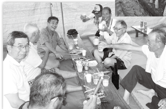
かんぱ〜い！竹灯籠も幻想的

上園観音の御開帳に合わせて、本堂前において上園観音祭りが開催されました。これは地域の住民の手で受け継がれてきた伝統行事であり、毎年旧暦の6月17日に行われています。