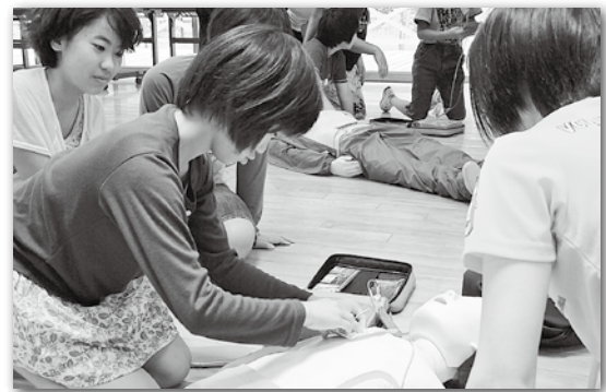
音声案内に従いAEDを準備

北小学校で子ども救命士講習が、講師に中分署の隊員と相良村女性消防隊を迎えて行われました。