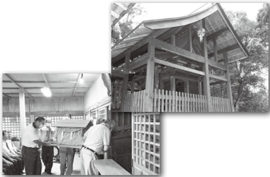
完成した覆屋(上) 遷座式の様子(下)

村指定の有形文化財である、四浦阿蘇神社の本殿を守る覆屋の竣工式が行われ、約60名の関係者と地域住民が参加しました。