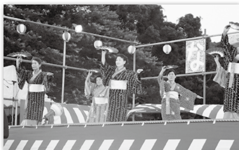
相良村婦人会による日本舞踊

今年もペートル会の夏祭りが、川辺川園で開催されました。ステージ中央の「な・つ・ま・つ・り」の看板は、ペートル会各施設の入所者の方々が一文字ずつ分担して作ったそうです。