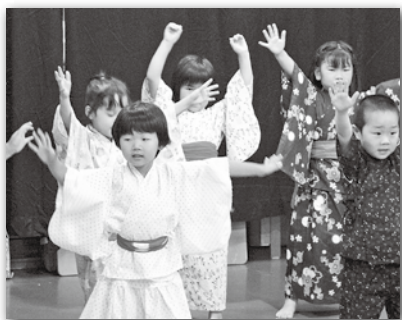
あざみ園児による 「なんじゃ、モンじゃ、ニンジャ祭り」