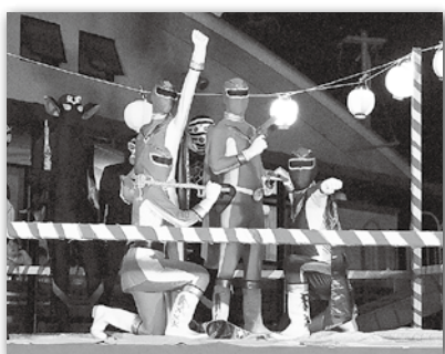
大人気！相良村のヒーロー 「チャレンジャー」