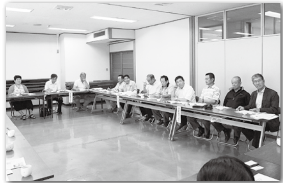
産業振興課の説明を聴く愛南町農業委員会の方々

愛媛県愛南町の農業委員会15名が、相良村の農業活性化事業の視察研修に訪れました。