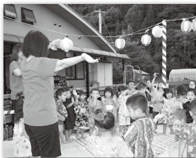
なつめ園児による「かかし音頭」