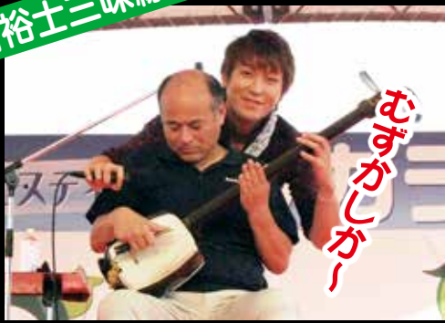
おもしろいかなー