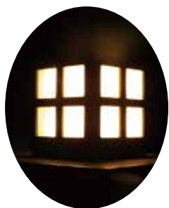
オレンジ色の光で柔らかな雰囲気を出