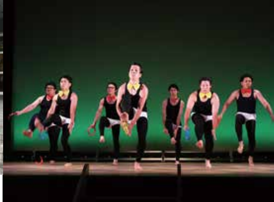
これぞ相良村青年団「タンバリン芸」