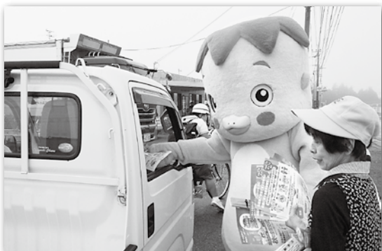
サガラッパもお手伝い。交通安全啓発グッズなどを手渡した

9月21日から30日までの秋の全国交通安全運動に合わせて、JA相良農機センター前において交通安全タッチ運動が行われました。運動には、交通安全協会相良支部や交通安全母の会などから15人が参加。