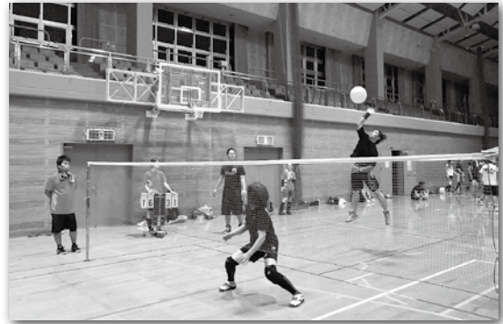
精一杯飛んでアタック!!

9月8、9日に相良村総合体育館において、相良村長杯ビーチボールバレー大会が開催され、総勢17チームが熱戦を繰り広げました。結果は下記の通りです。