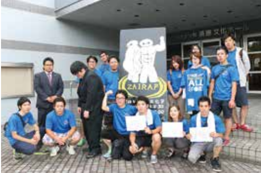
手作り看板の前で集合写真