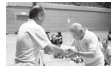
優勝チームにはビールを贈呈