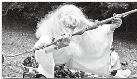
老ひひの迫力ある舞

晴山(四浦)で9月23日、北嶽神社秋の大祭が開催され、地元住民や大勢の観客が集いました。