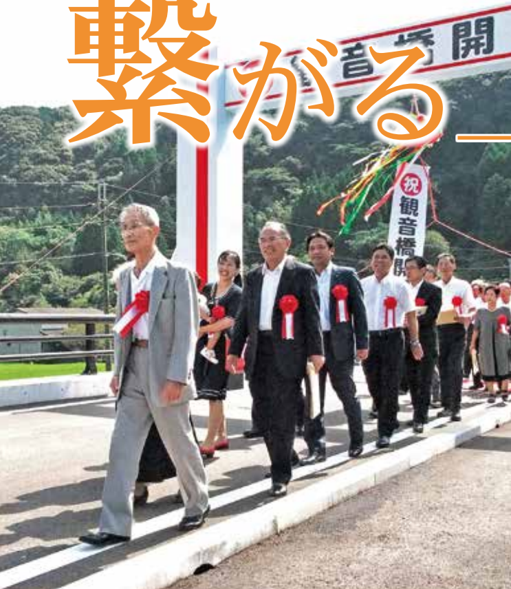
三代夫婦を先頭に喜びの渡り初め

この観音橋が、夜になると違った一面を見せてくれます。太陽光を利用した格子状のデザインの電灯が、柔らかな光で橋を照らします。