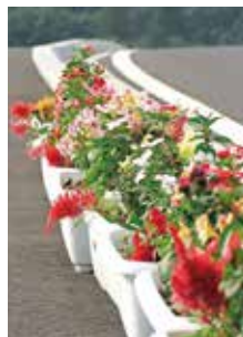
きれいな花々がお出迎え