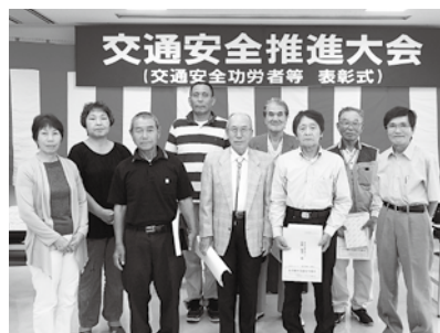
表彰された永年無事故無違反のみなさん