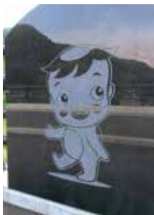
サガラッパの他にも、茶摘みの風景など様々なイラストがある