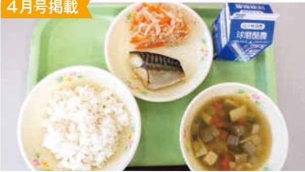
4月から村内の小中学校の給食費無償化