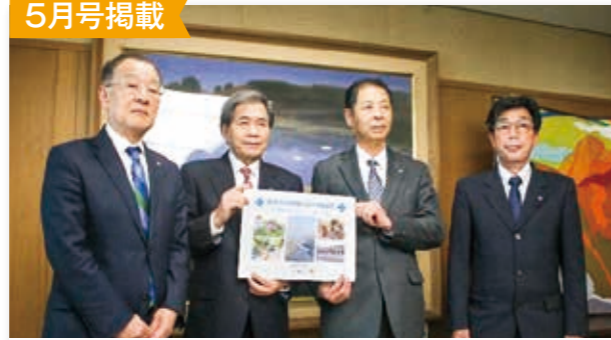
熊本県から相良村振興策への取組み(190項目)提示