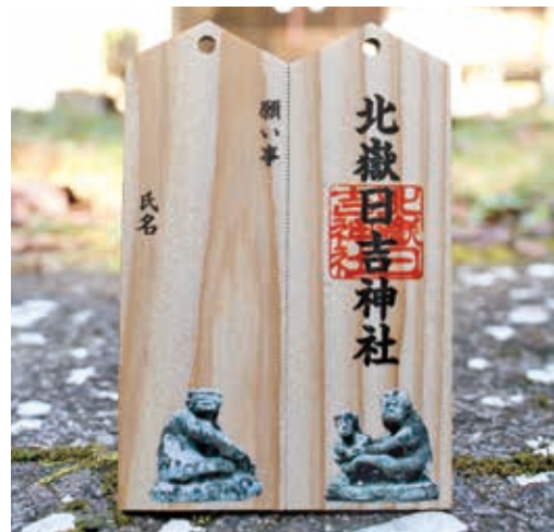
新たに作製された北嶽日吉神社の「割れる絵馬」

四浦晴山地区で、北嶽日吉神社の絵馬を新しく作製しました。地域活性につなげたいと思い、試行錯誤のうえ完成。作られた絵馬は、2つに割ることができ、片方を神社へ結び、片方をお守り代わりに持ち帰ることができます。