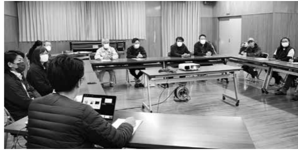
相良茶について意見交換を行う

総合体育館1階研修室で、相良茶の振興に向けた勉強会・意見交換会が行われ、村内のお茶農家7人が参加しました。