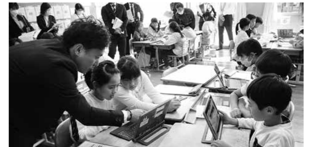
3年生での授業の様子

熊本県教育委員会から、「健康教育」研究推進校に指定された相良南小学校で研究発表会が行われ、県内から約100名の教育関係者が参加しました。