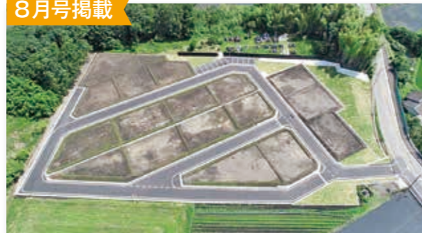
相良村住宅地造成工事(せせらぎの丘)竣工