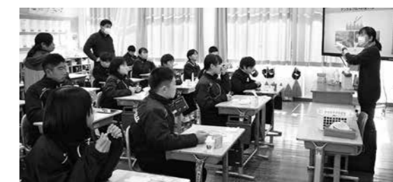
相良中学校で行われたブラッシング教室の様子

12月4日(月)に相良中学校1年生、12月12日(火)に相良南小学校6年生を対象にブラッシング教室を行いました。正しいブラッシングのやり方やフロスの使い方などを学習しました。歯をしっかりと磨いて、むし歯になりにくい健康の歯を目指しましょう。