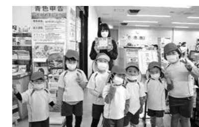
四浦保育所あざみ園