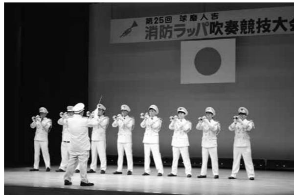
出場した相良村消防団のラッパ隊のみなさん

あさぎり町須恵文化ホールで、4年ぶりとなる第25回球磨人吉消防ラッパ吹奏競技大会が開催され、相良村からは相良村消防団ラッパ隊(9人)が出場しました。