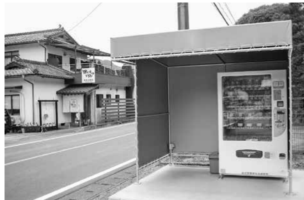
店向かいに設置された自動販売機

中四浦地区で経営している「親父のガンコとうふ」の商品を販売した自動販売機が設置されました。