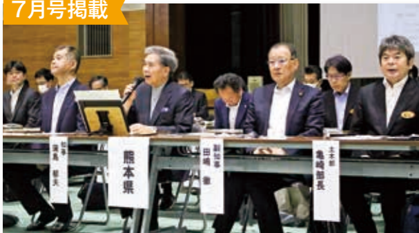
蒲島知事による相良村振興策に対する村民説明会