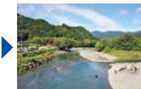
9月30日・10月1日 実証実験イベント

11月27日（月）午後7時、相良村総合体育館で「川辺川魅力創造事業」の計画策定に向けたワークショップ「大作戦会議」が開催され、55名の方が参加されました。