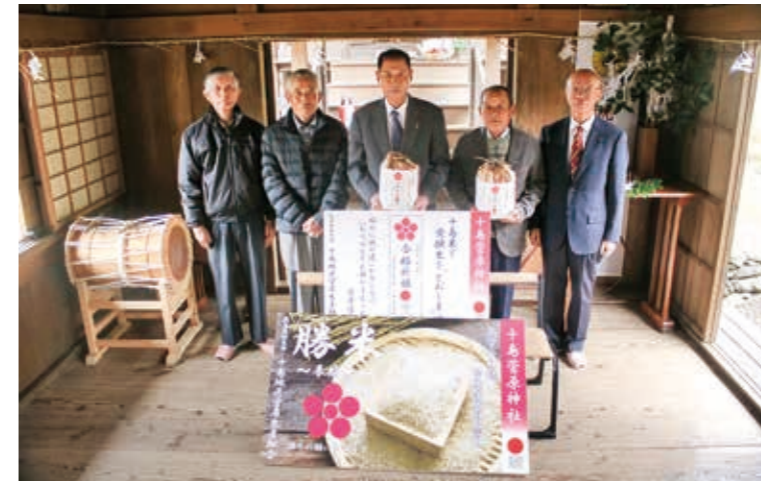
十島米を使用した「勝米」をもつ関係者たち

去年と同様に、1月に相良中学校の3年生に合格祈願として勝米を配布される予定です。