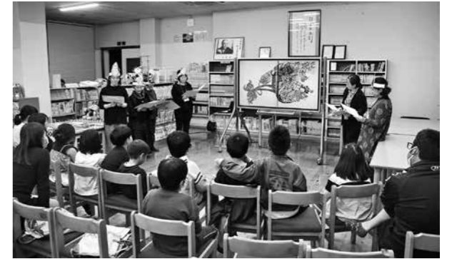
手作りのお面を使って読み聞かせを行う

相良南小学校の図書館で、相良村読み聞かせボランティア「どんぐりの会」の読み聞かせ会が行われ、およそ40人が参加。本に親しみを持ってもらえるよう、また、読み聞かせを通じて心の栄養を届けたいと思い始められました。