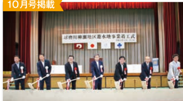
球磨川流域で始めてとなる柳瀬地区における遊水地の着工式