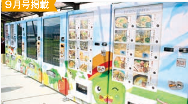
柳瀬地区に相良村自動販売機7台設置