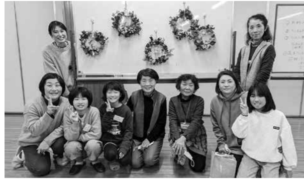
作成したクリスマスリースと参加者たち

相良いけばな教室「親子でいけばな」が相良村総合体育館研修室で行われ、受講生3名とその保護者が参加し、助け合いながらクリスマスリースを作成しました。