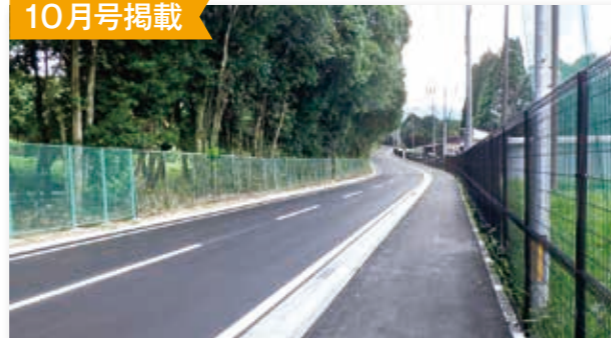
村道平原十島線道路改良工事(十島工区)竣工