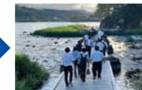
9月21・22日 職員・観光協会視察研修