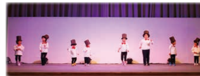
あざみ園 キッドピクス