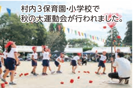
村内3保育園・小学校で秋の大運動会が行われました。