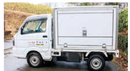
こちらの車で配送します