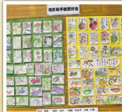
相良絵手紙愛好会