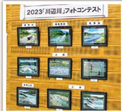
フォトコンテスト.