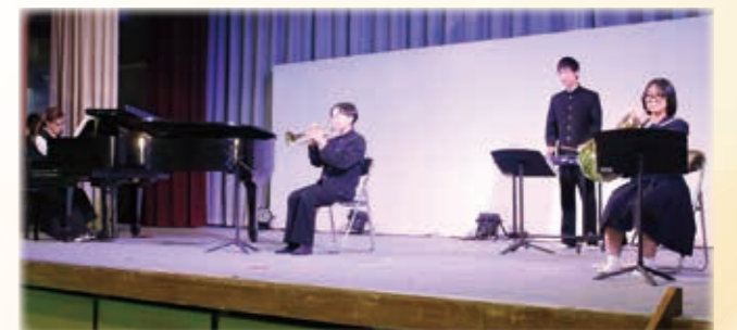
相良中学校 吹奏楽