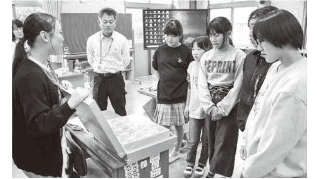
1億円のレプリカを眺める児童たち

相良北小学校で租税教室が行われ、5・6年生5人が参加。租税に関する意義や役割などを正しく理解してもらい、税に対する理解が広まることを目的に行われました。