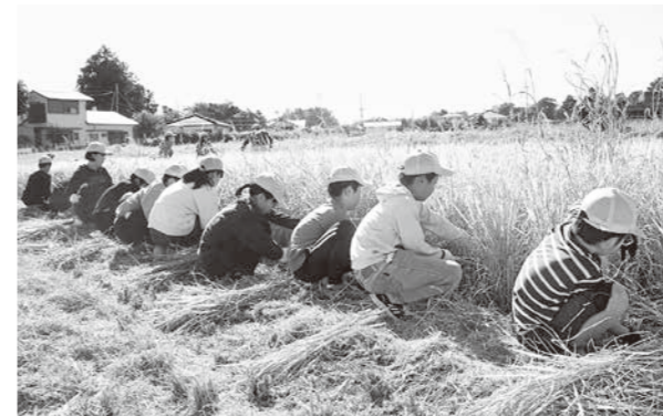
上手に鎌を使って収穫する児童たち

相良南小学校5年生33人が総合的な学習の時間を使って、6月に田植えをしたもち米の収穫を行いました。JAくま青年部相良支部の協力のもと、児童たちに鎌での収穫の方法を教えてくださいました。