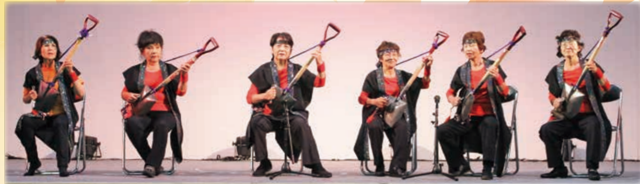
JA女性部スコッパズ相良