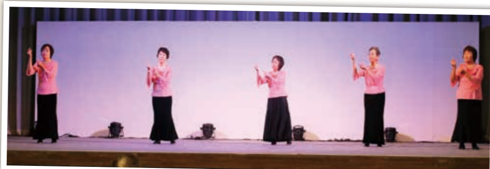
球磨・人吉手話ダンス