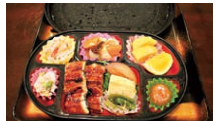
茶湯里で作られたお弁当 (写真はおかずのみ、不定期の特別メニュー)

相良村地域包括支援センター 0966-35-1144 または保健福祉課福祉係 0966-35-1032