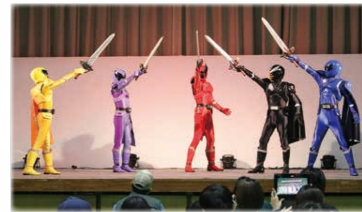
キャラクターショー「王様戦隊キングオージャー」