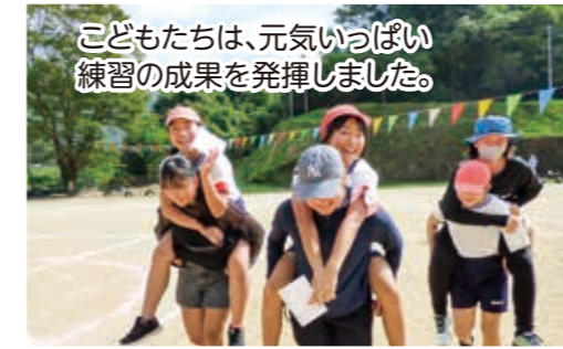
子どもたちは、元気いっぱい練習の成果を発揮しました。