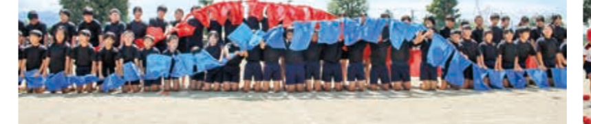
綺麗なウェーブができた