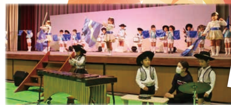
なつめ保育園 鼓笛隊