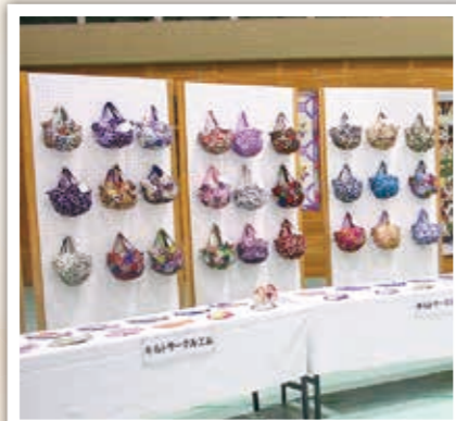
キルトサークルエムの作品