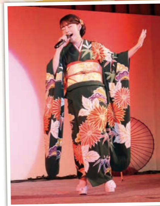
メインタレントショー「丘みどり」