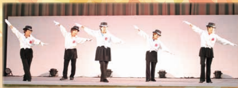
JA女性部レクレーションダンス