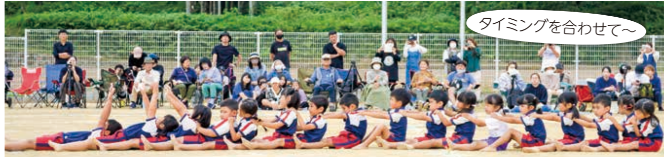
タイミングを合わせて～