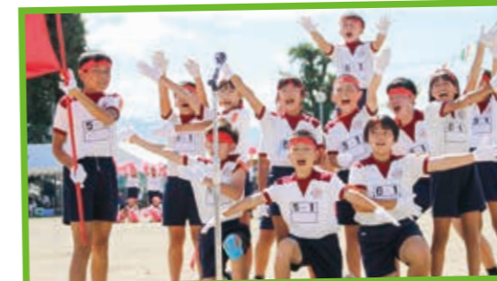
赤・白 かっこいい