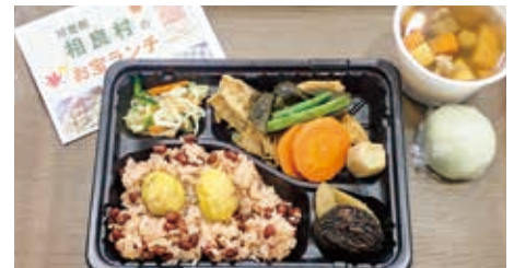
相良村の食材で作ったお弁当