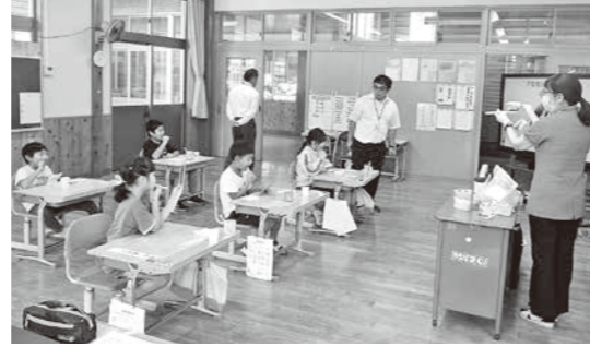
ブラッシング練習をする児童たち

相良北小学校で、歯科衛生士によるブラッシング教室が行われました。正しいブラッシングのやり方やフロスの使い方などを学びました。歯をしっかりと磨いて、虫歯になりにくい歯を目指しましょう。