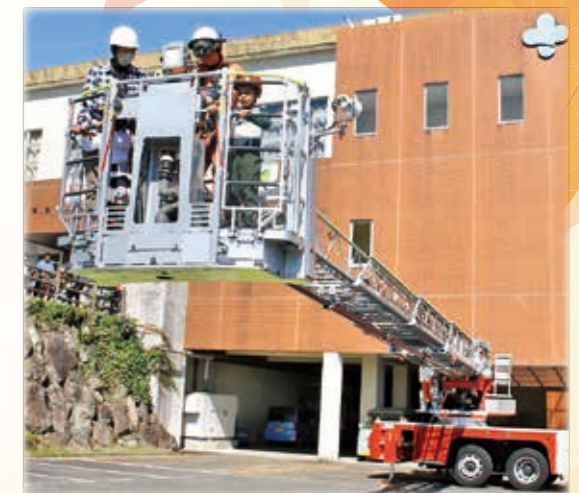
はしご車搭乗体験