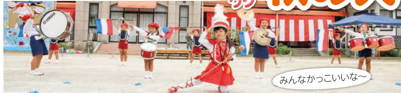
みんなかっこいいな～