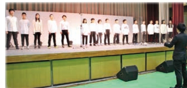
相良南小学校 合唱