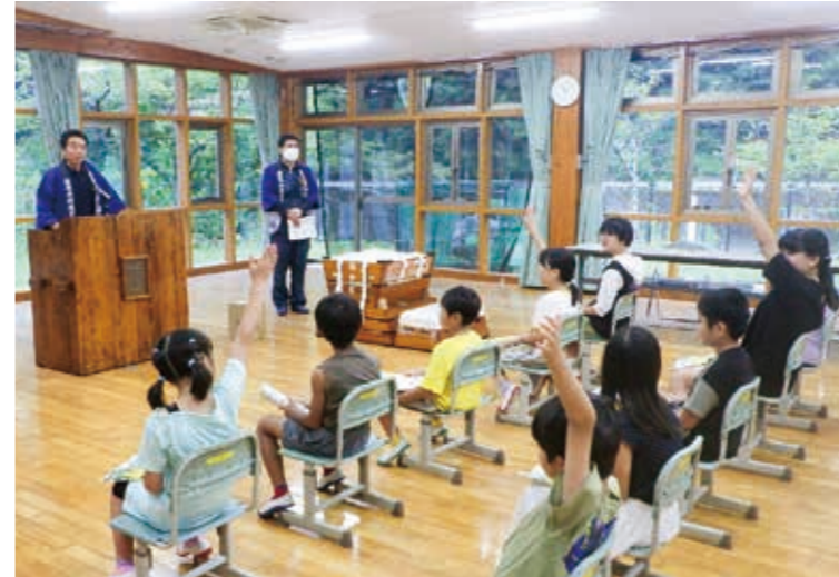
北小学校での木育の授業