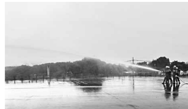
放水訓練を行う消防団員

熊本県防災消防航空隊、村消防団及び人吉球磨消防組合を対象とした防災訓練が行なわれ、およそ100人が参加しました。円滑な部隊の連携活動と、消防防災ヘリコプターの特性を活用した安全・確実・迅速な活動要領の構築を目的に行われました。