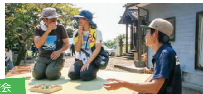
茶屋の上でお茶を楽しむ