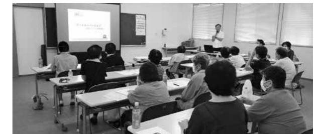
ゲートキーパー養成講座の様子

相良村婦人会会員15名を対象にゲートキーパー養成講座を開催しました。ゲートキーパーとは、「命の門番」と言われており、悩んでいる人に気づき、適切な対応ができる人のことです。