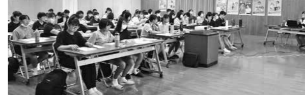
講演を聞く出席者