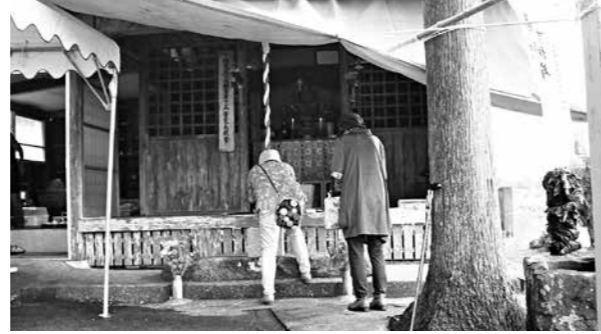
蓑毛観音での参拝の様子

相良三十三観音めぐり秋の一斉開帳が行われました。人吉球磨にある33か所の札所のうち、相良村には5か所の札所があります。14番札所の十島観音、15番札所の蓑毛観音、16番札所の深水観音、17番札所の上園観音、18番札所の廻り観音が開帳されました。