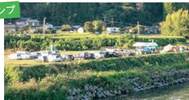
対岸から見たキャンプの様子