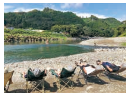
川を見ながら「整う」