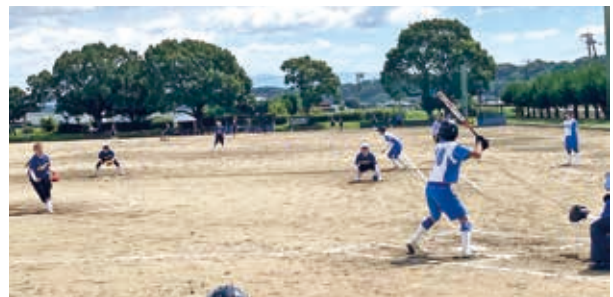
女子ソフトボールの試合の様子