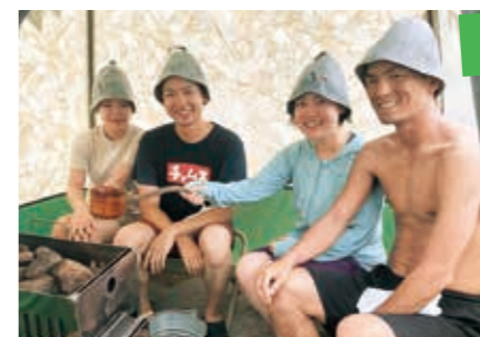
テントの中の様子