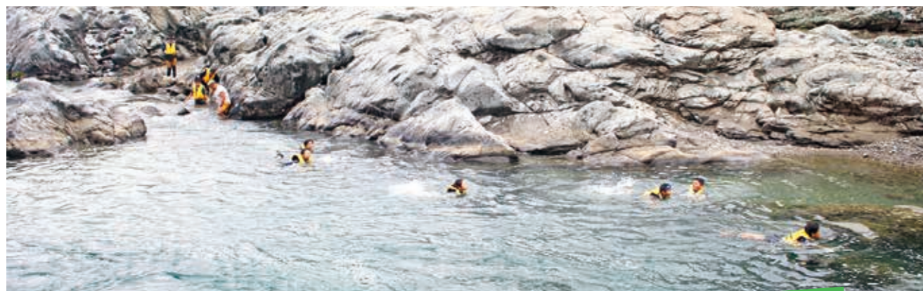
元気に川をくだる子どもたち