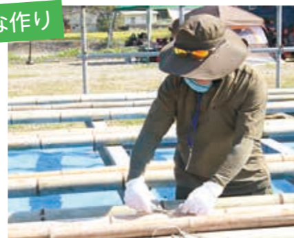
竹どうしをつなげる