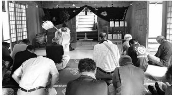
厳かに行われた神事

秋分の日の23日(土)、四浦晴山地区の北嶽神社で大祭が開催されました。午前10時からの大祭には、地元住民およそ20名が参拝しました。