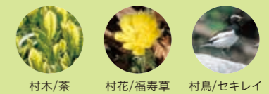
村木/茶 村花/福寿草 村鳥/セキレイ