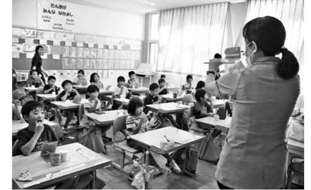
丁寧に歯を磨く児童たち

相良南小学校で、保健福祉課主催のブラッシング教室が行われ、1年生25人の児童が参加。歯磨きなどについて学習しました。