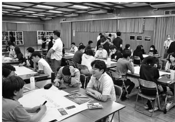
大作戦会議の様子