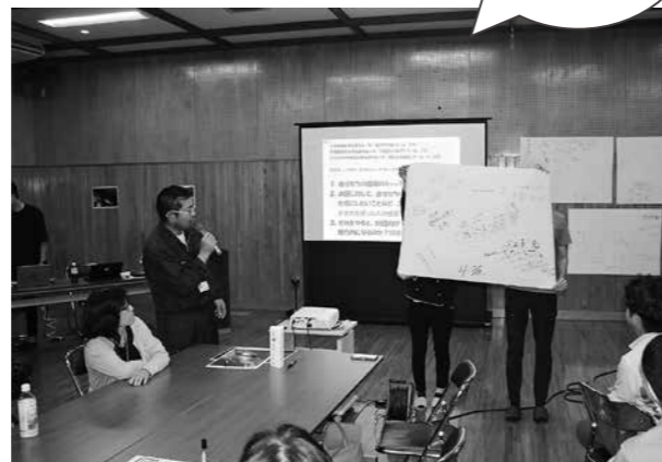
グループで出し合った意見を発表

9月7日(木)、総合体育館研修室で2回目となる役場職員を対象とした川辺川の魅力を発見するための意見交換会を行いました。今回も役場職員だけでなく、国土交通省川辺川砂防ダム事務所などからも参加いただき開催しました。