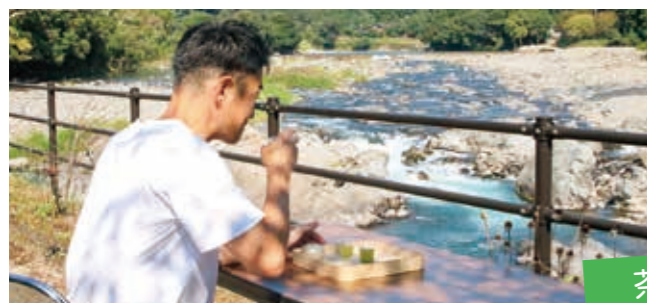
川を見ながら一息