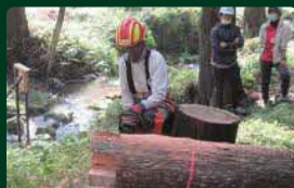
林業就業者による伐倒の実演

森林の働きを最大限に発揮させるために、植樹や間伐を行い健やかな森林を維持します。