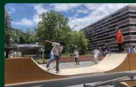
スケートボードセッションの制作