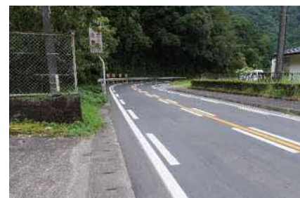
①急カーブであり歩道は設置されているが危険

<対策メニュー> カラー舗装等を設置 H31.1.22～ 継続要望 暫定対策済み(減速効果破線)