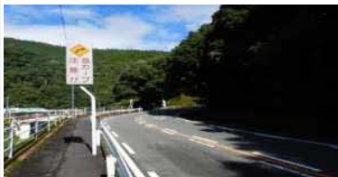
②急カーブ箇所に校門があり危険