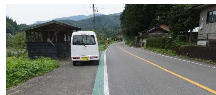
③歩道が設置されておらず危険

<対策メニュー> カラー舗装等を設置 H31.1.22～ 継続要望 暫定対策済み(減速効果破線)