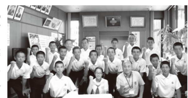
村長に活躍を誓う生徒ら

剣道が九州大会と全国大会、軟式野球と陸上が九州大会出場を果たした相良中学校。7月31日(月)に生徒らが役場を訪れ、村長と教育長に県大会の結果を報告し、次の舞台への所信を表明しました。