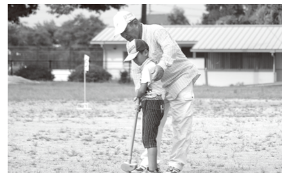
児童に丁寧に教える一般参加者

ふれあいグラウンドゴルフが南北両校区で開催され、児童と地域住民の交流が図られました。各部門の優勝者は下記のとおりです。