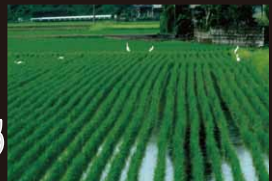
吉松孝雄 『白鷺の戯れ』