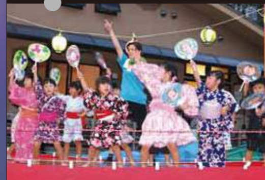
なつめ保育園夕涼み会