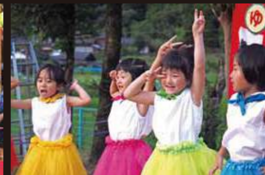
四浦保育所あざみ園夕涼み会