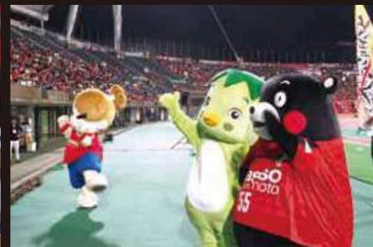
ロアッソ熊本のホームゲームでサガラッパが相良村をPR