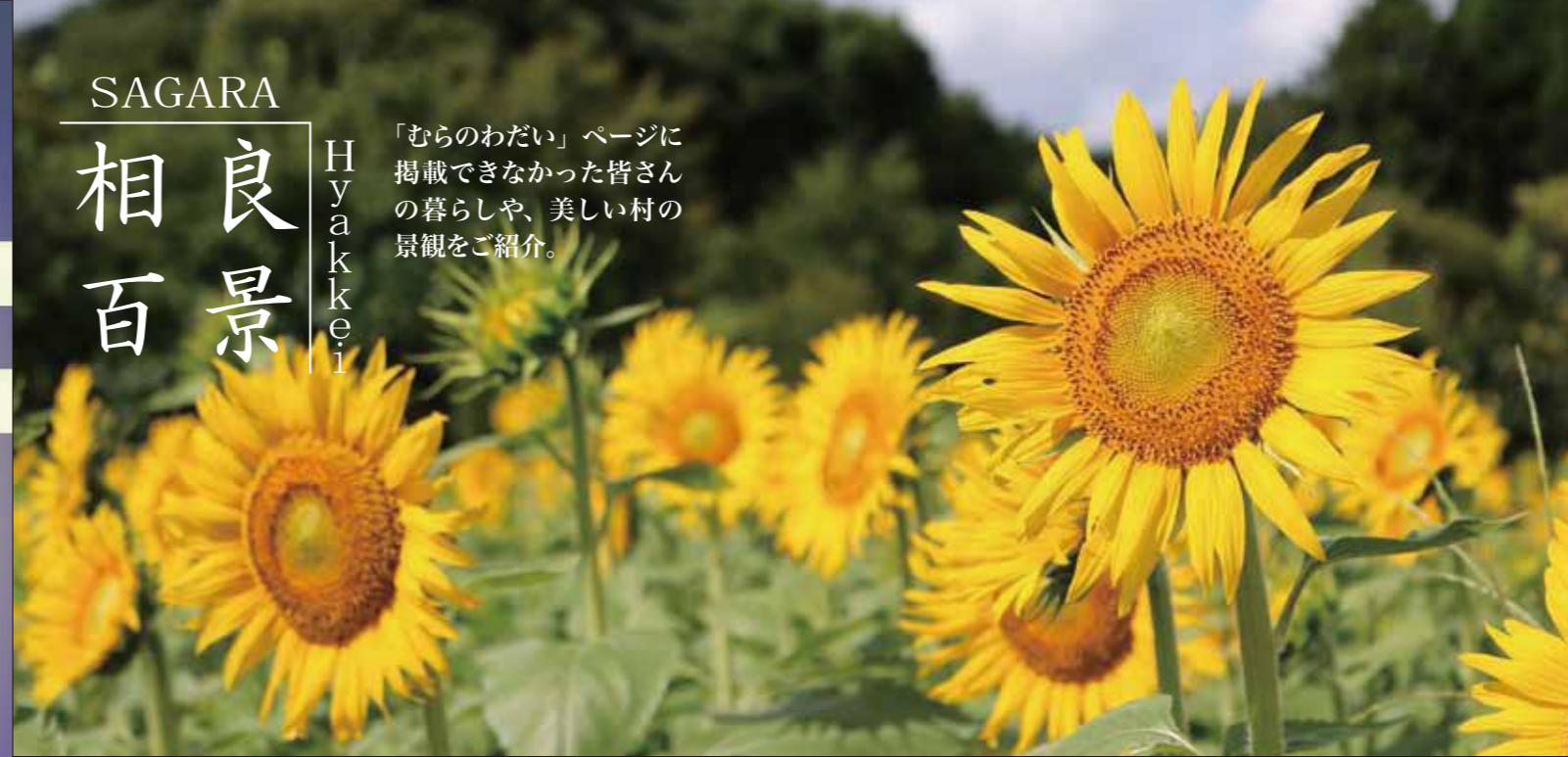
太陽に向かって一面に咲くヒマワリ

「むらのわだい」ページに掲載できなかった皆さんの暮らしや、美しい村の景観をご紹介します。