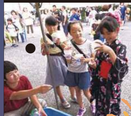
ペートル会夏祭り