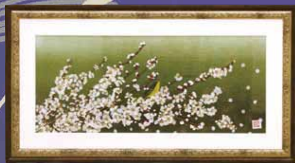
『梅の花とうぐいす』 白砂 禮子 (松馬場)

芸術品を募集しています！ 皆さんの作品を広報紙に掲載しませんか？ 総務課企画情報係にご相談ください。 【問合せ先】☎35-0211 担当 大園