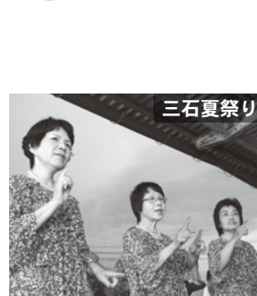
手話ダンスクラブが ステージを飾る