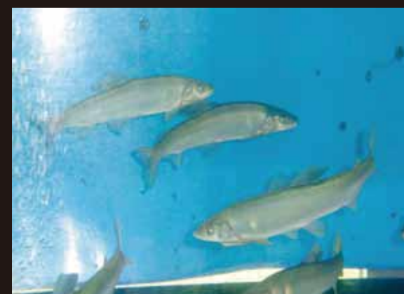
『川辺川の大鮎』 井上 日出海 (新村)