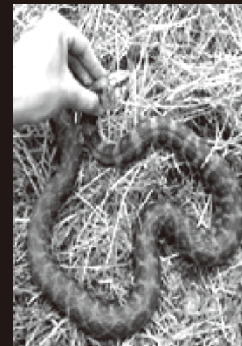
色彩変異による黒色の個体