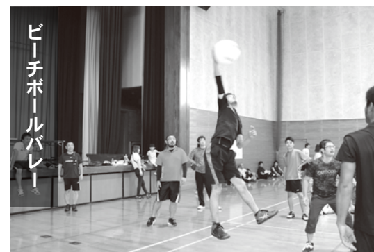
渾身のスパイク決まるか!