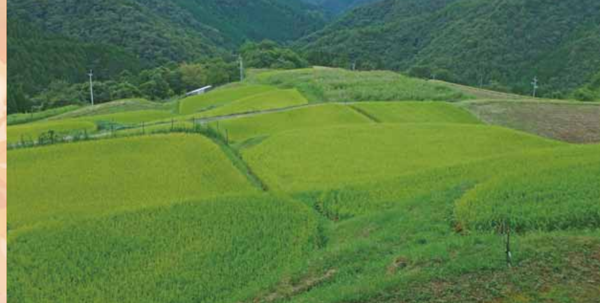
収穫を間近に控える夜狩尾の棚田