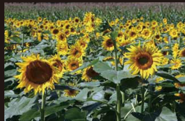
『咲き誇る』 白石 哲夫 (松葉)