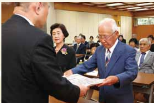
熊日新聞社から表彰状を受け取るお2人