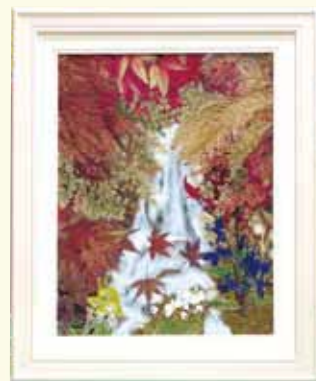
『紅葉』 松本 テル (上園)