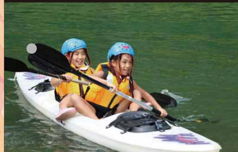
相良北小学校 児童が川辺川 でカヌー体験