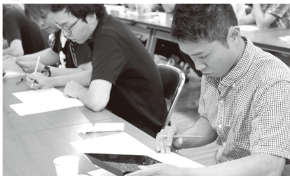
茶葉の外観を見定める参加者ら

茶生産技術の向上と生産者の交流を目的とする恒例行事、「熊本県茶業青年の集い」が相良村と人吉市で開催されました。