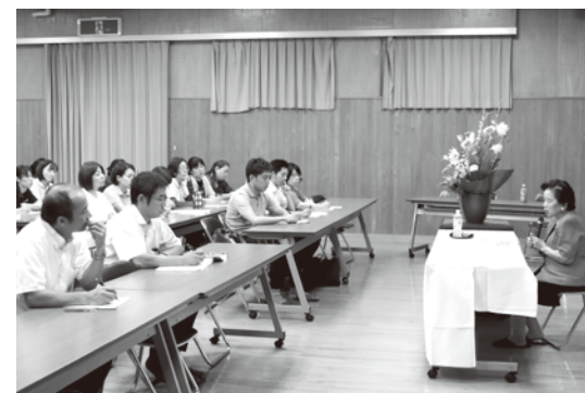
「見つめなおそう家庭の力」 ～子どもは親の生活のクセをコピーしています～

発掘体験では、石室と、周溝を確認するための「試掘溝」に分かれて作業。大学生から「一か所だけでなく面で掘り進めるイメージで」とアドバイスを受けながら、スコップで掘り進めていきました。土器の欠片がたびたび出土し、児童らは初めての体験に目を輝かせていました。