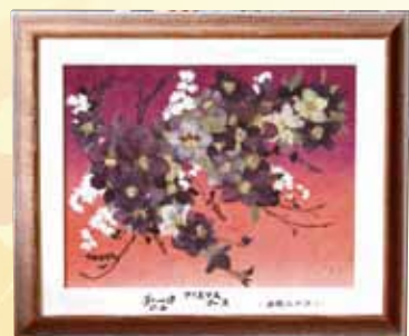
『クリスマスローズ』 友田 十江 (松馬場)