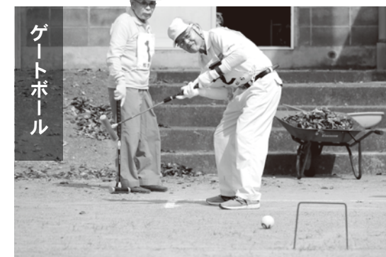
まずは1番ゲート通過を目指す