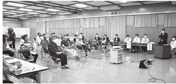
遊水機能を有する土地について説明を受ける地権者

熊本県主催の「遊水機能を有する土地」における説明会が行われ、吉松村長や地権者およそ20人が参加されました。