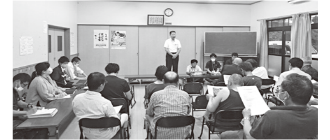
井沢地区での説明会の様子

並木野地区と井沢地区における農地の基盤整備事業の説明会が行われ、およそ40名の地権者が参加されました。