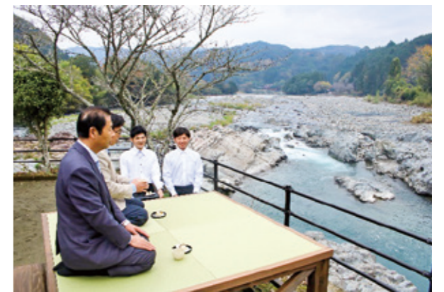
※4 令和4年度の実証実験(廻り観音周辺)

R4年度に引き続き、拠点施設に必要な機能等を検討する村の実証実験を実施するとともに、事業方針及び事業計画を策定し、R7年度の事業着手を目指して支援を行う