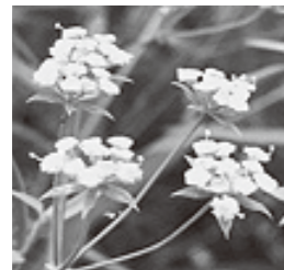
ミシマサイコの花

ミシマサイコ栽培を希望される方、栽培をしたいが迷っている方、興味のある方を対象に、説明会を9月下旬に予定しています。説明会へ参加ご希望の方は産業振興課振興係(☎35-1034)までご連絡をお願いいたします。