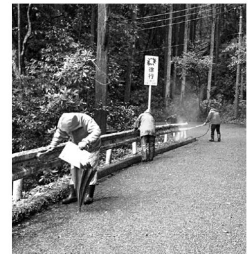
上園区地域づくり委員会の活動の様子

※当該補助金は地域の合意形成が必要で、活用するためには要件があります。詳しくは総務課企画復興係にお問合せください。 ☎0966-35-0211