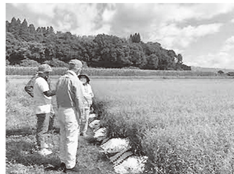
村葉草部会圃場調査の様子