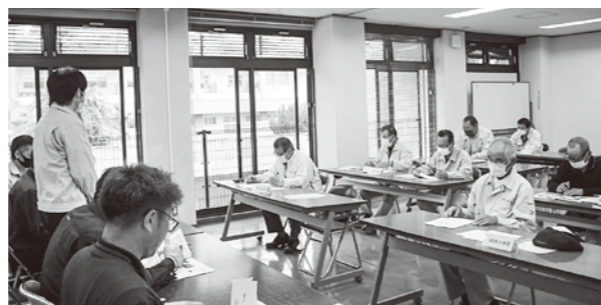
樋門操作の説明を受ける

役場2階大会議室で、国土交通省八代河川事務所と役場建設課主催の樋門操作説明会が行われ、村内の樋門操作者8人が参加されました。