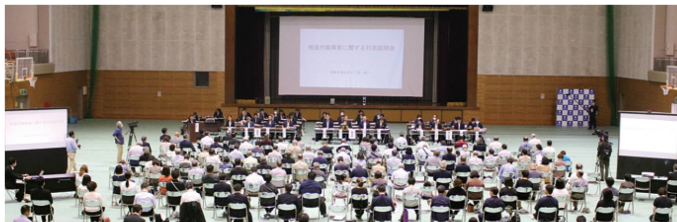
村民説明会の様子