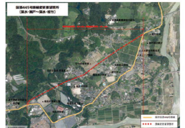
※2 国道445号の路線の変更計画図

小柏(瀬馳)地区から山口(津留)地区間について、「過疎地域の持続的発展の支援に関する特別措置法」に基づき村に代わり、新規に林道整備に着手する