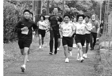
「百年杉タイム」での10分間走の様子(R4.11.29)

もちろん、本を読み終えた私は、ランニングに出かけました。生徒の皆さんはもちろんですが、村民の皆様も、ランニングやウォーキングを習慣化し、心と体、そして脳を鍛えましょう。人生100年時代です。