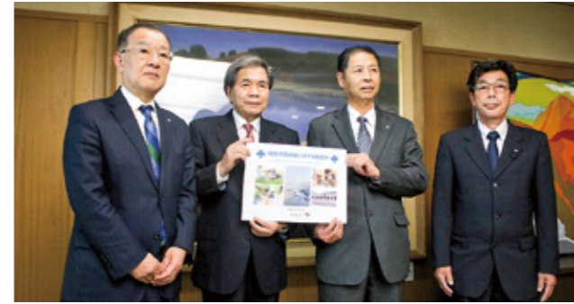
蒲島県知事からの取組み提示