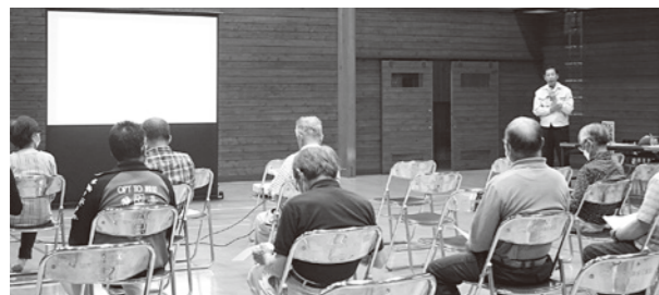
林業総合センターでの説明会の様子

林業総合センターで、熊本県主催の国道445号の道路改良計画及び川辺川(平川地区)の河川整備に関する説明会が行われ、関係住民およそ20人が参加されました。