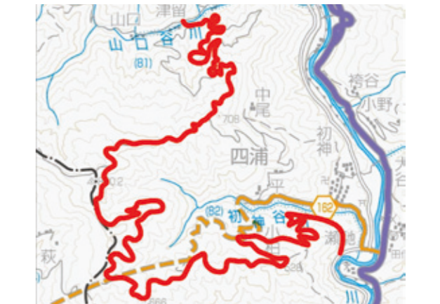
※3 林道四浦西線の計画路線図

新たな企業誘致に向け、村・県の関係部局でプロジェクトチームを立ち上げ、協議検討を進める