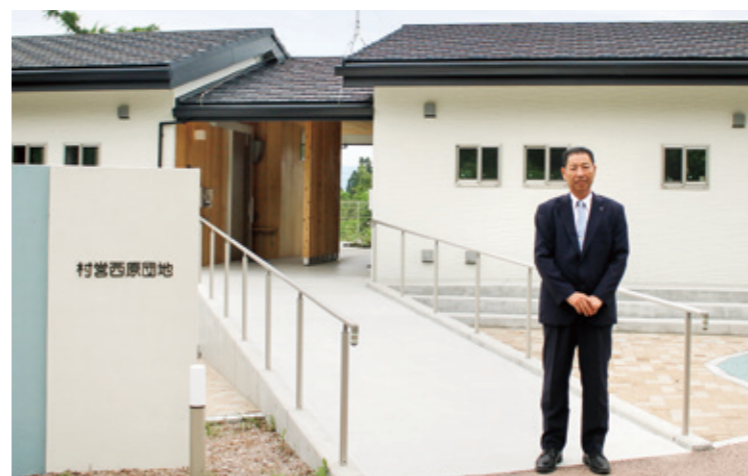
災害公営住宅(茶湯里温泉近く)

豪雨災害から3年、本村では、家屋や納屋がおよそ400棟、村道、林道、河川、農地(水稲、葉タバコ含む)、農業機械、水産施設、老人ホーム、保育園や学校などの文教施設、消防施設、上下水道施設、山腹崩壊などの甚大な被害を受けました。しかしながら、村民の皆様や消防団員のご尽力により人的被害が無かった事が誇りです。 災害後、敏速な復旧に努め、仮設団地は村有団地として活用し、災害公営住宅を新たに建設しました。また、村道災害の90%、林道災害の70%が復旧しました。農地の災害復旧も完了しましたが、昨年の台風14号で再び被害を受けた箇所については随時復旧作業を行っております。 浸水被害の大きかった4箇所・5地