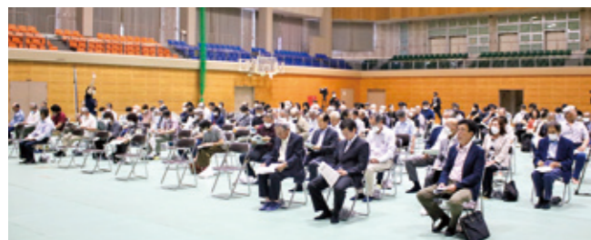
参加された村民のみなさん