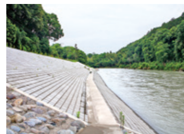
大曲(柳瀬西溝をつつむ川辺川護岸)