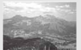
「俵山から阿蘇山を望む」

じクラブ」の会員と合同で、阿蘇郡西原村と南阿蘇村にまたがる標高1,095mの山で、山頂は西原村にある「俵山」へ登ってきました。「俵山」登山は2回目(前回は平成26年)でしたが、すでに体力の限界を感じ、一度は諦めた登山でしたが、天候にも恵まれ、登頂した時の達成感と、俵山からみた阿蘇山の景色は、登る途中のきつさを忘れてしまうくらい素晴らしく感動しました。小学生のほとんどが初めての登山だったようですが全員無事登頂することができました。皆さまも、一度、登られてみてはいかがでしょうか。