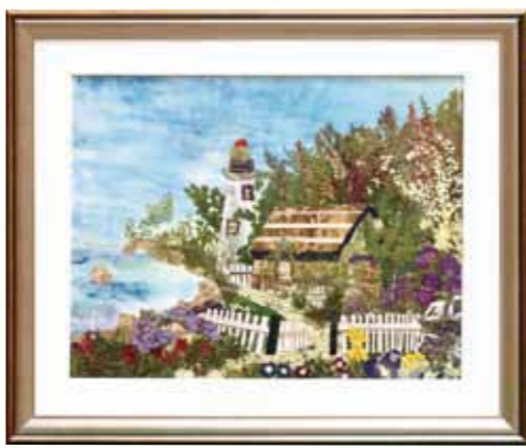
『灯台』 上村 喜代子 (新村)

【問合せ先】 やよい会・やまばと句会 相良村文化協会 ☎35-11039 さがら押し花の会 代表 永田町代(上園)