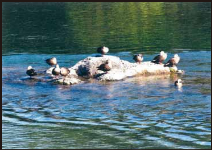
▲田上新子 (松葉) 『飛 来』 ◀白石哲夫 (松葉) 『霧を跨ぐ』