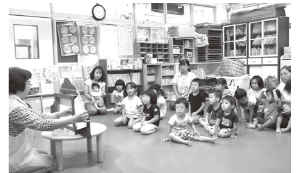
紙芝居に真剣に見入る園児ら

四浦保育所あざみ園にて、人吉人権擁護委員協議会による人権教室が開催。園児およそ15人が参加しました。