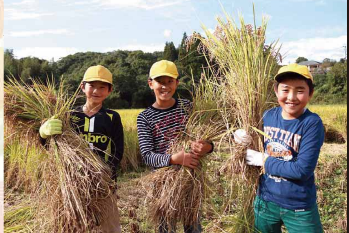
相良南小学校5年生が稲刈り体験を通して米作りを学ぶ

「むらのわだい」ページに掲載できなかった皆さんの暮らしや、美しい村の景観をご紹介します。