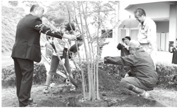
記念植樹の木に土をかぶせる参加者ら

相良村総合体育館と瀬戸堤公園にて、人吉球磨地域みどり推進協議会と相良村の主催、植樹祭が開催されました。これは、毎年同協議会が会場持ち回りで開催しているものです。