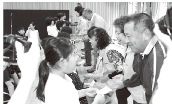
「人権の種」を人権擁護委員らに贈った

「人権の花運動」開催校の相良北小学校で終了式が行われ、児童らが育てた、マリーゴールドなど5種類の花の種が人権擁護委員らに贈られました。