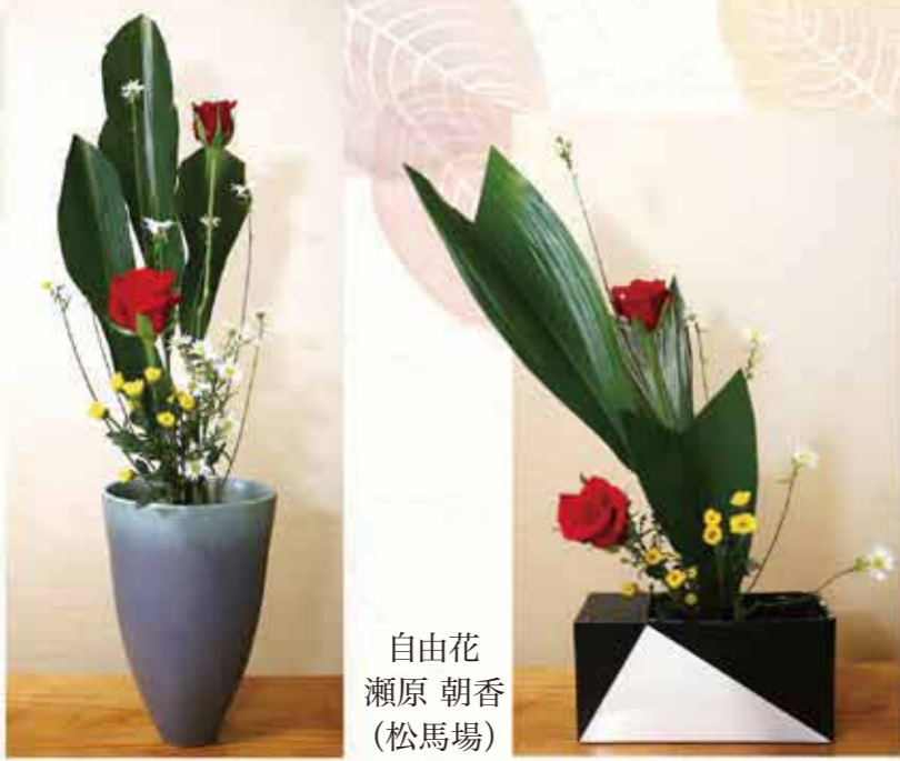
自由花 瀬原 朝香 (松馬場)