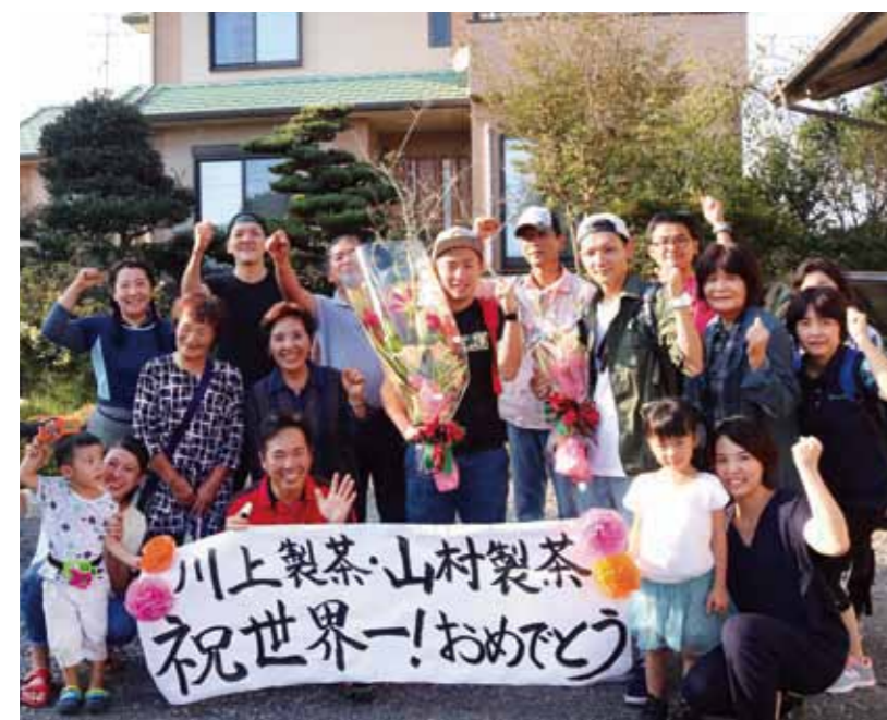
シンガポールから帰村後、チーム相良がサプライズでお出迎え

この自分から動く意識がチーム相良に浸透していき、グランプリを通じて出会った、全国の事業者と積極的にコンタクトをとるようになってきました。この「出会い」は大きな魅力の1つ。各分野のプロの知識を吸収し、自分の商品に磨きをかけていく。その一つ一つが相良村の宝物として、相良ブランドをつくりあげていくのではないのでしょうか。