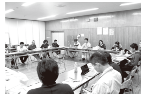
会議には農家や大学教授など多業種から17名が出席した

これまで、商品開発や国際交流、人材育成事業などに取り組んできました。特に商品開発と国際交流では、「にっぽんの宝物」ブランド世界大会における相良茶のグランプリ獲得、フランスのセント・ヴァレンティン村と連携した相良村ヴァレンティン祭の開催など成果を挙げてきました。そして、ヴァレンティン村との交流においては、ことし11月10日に姉妹都市締結を結びました。