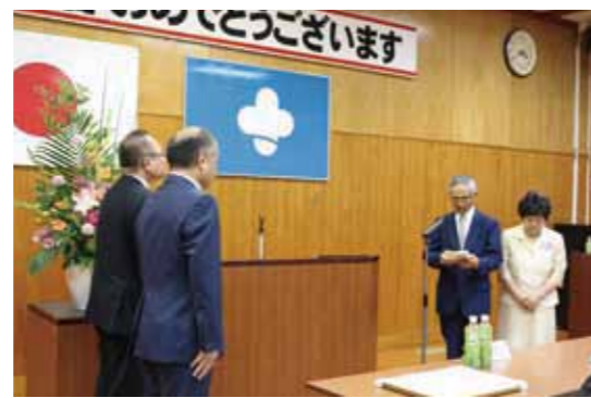
感謝の言葉を述べるお2人