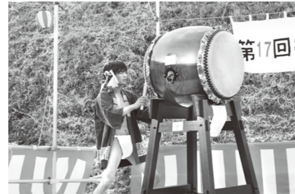
会場に響き渡る和太鼓

本年度、宝くじ助成事業※により井沢地区が和太鼓を購入され、恒例の夏祭りにお披露目されました。練習を積まれた叩き手の方が、リズムよく太鼓を叩き、会場を沸かせていました。当地区は平成13年から盆に合わせて夏祭りを始められ、以来帰省客をはじめ、多くの方で賑わっています。購入した太鼓は130万円。全額が宝くじ助成事業として、(財)自治総合センターから交付されました。地域の方は、夏祭りのほか子ども会、井沢権現神社大祭などで活用し、地域活性化につなげたいと話されていました。