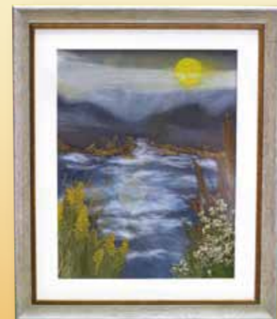
『川辺川の月』 友田 十江 (松馬場)

【問合せ先】 やよい会・やまばと句会 相良村文化協会 ☎35-11039 さがら押し花の会 代表 永田町代