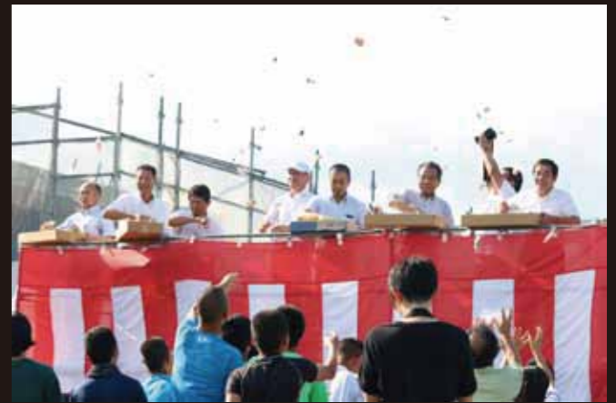
もらなげ 南小共同調理場の上棟式 多くの人でにぎわいました