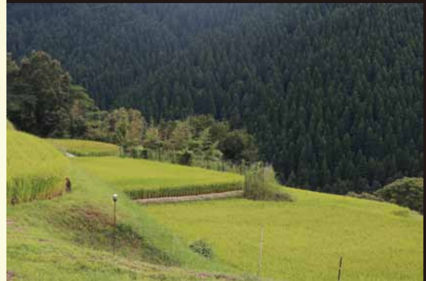
実りの秋 色づきはじめる夜狩尾地区の棚田