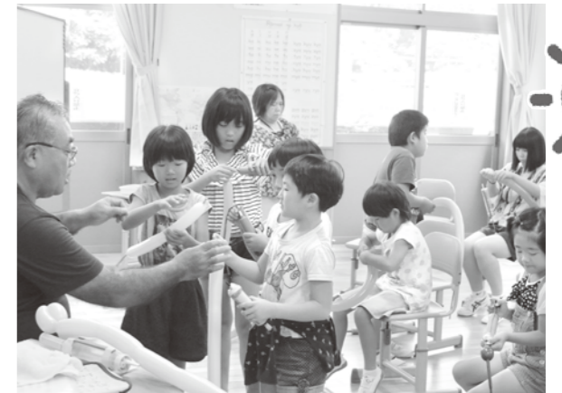
割れないようにそっと「バルーンアート」