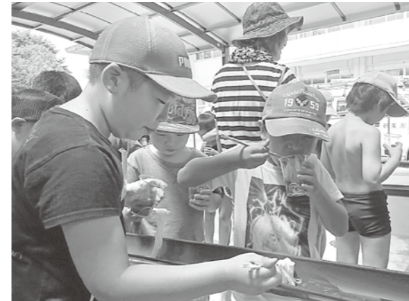
上手につかめるかな「そうめん流し」

生活協同組合くまもとと「相良村生活応援包括連携に関する協定」を結びました。内容は高齢者の見守り活動や災害時の応急生活物資供給、村の特産品の販路拡大に関するもの。住民の福祉の向上や暮らしの安全や安心のために締結されました。この内、特産品の販路拡大については、県内初の協定内容。調印式には、当組合理事長を含めた6人と村長や各課長らが出席しました。徳田村長は、「相良村の特産品の販路拡大にも携わってもら。地域住民のさらなる幸福の最大化を目指したい」と述べられました。