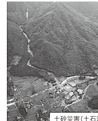
土砂災害（土石流）の発生状況

土砂災害は、毎年全国で平均1,000件程度発生しており、土砂災害の恐れがある危険な箇所も新たな宅地開発などにより年々増加しています。