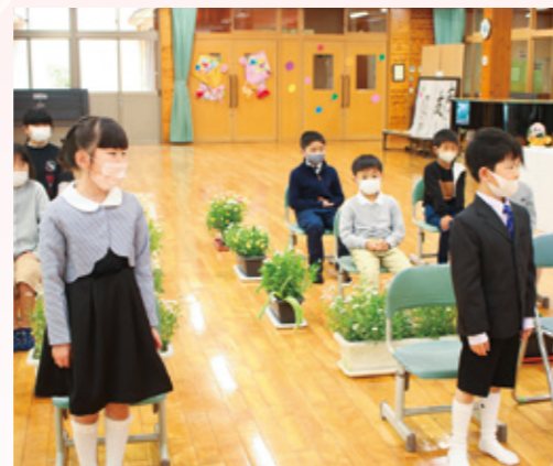
少し緊張した様子の新入生