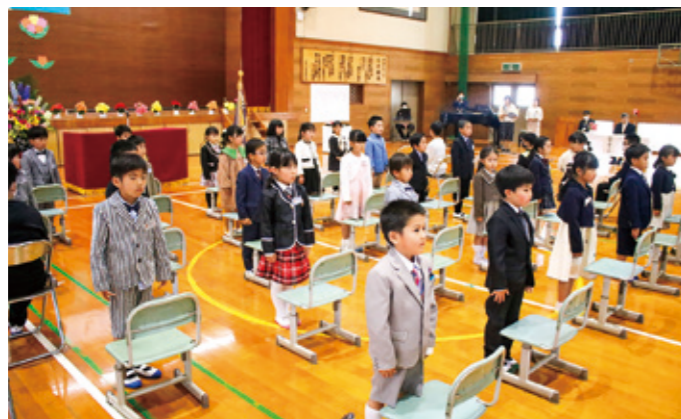
名前を呼ばれて、元気に返事をする新入生