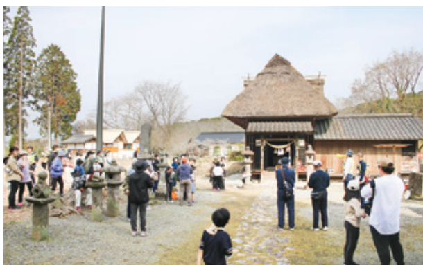
十島菅原神社を訪れる

参加した方々は「暑い中でしたが、とても気持ちよく歩くことができました」「歩き疲れましたが、楽しかったです」と話しました。参加者たちは、春風を受け、咲き誇る花々を愛でながらウォーキングを楽しみました。