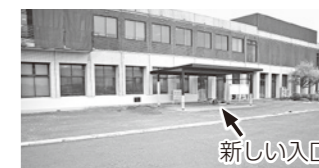
総務課・税務課前の通路を広げ、段差を解消しました