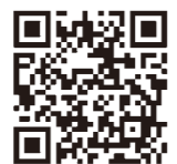
フィーチャー・フォン(ガラケー)の場合