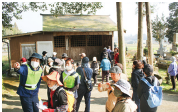
蓑毛観音堂を訪れる