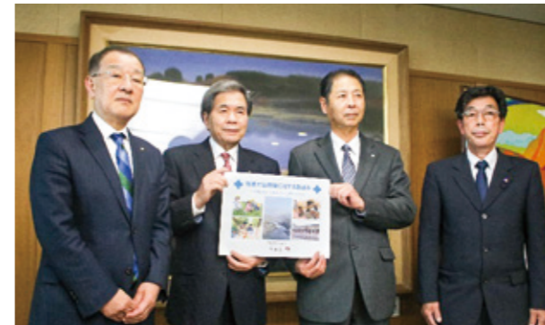
蒲島県知事からの取組み提示