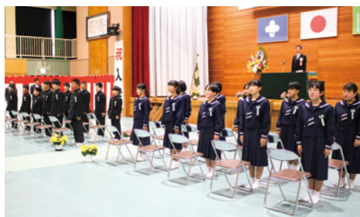
初々しい制服姿の新入生