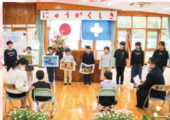
在校生から新入生に「入学おめでとう」

4月11日(火)、村内小中学校で入学式が行われました。保護者や在校生などが見守る中、 新入生たちは、これからはじまる学校生活への希望を胸に入学を迎えました。