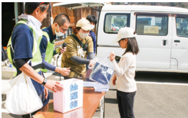
抽選会の様子 何が当たったかな