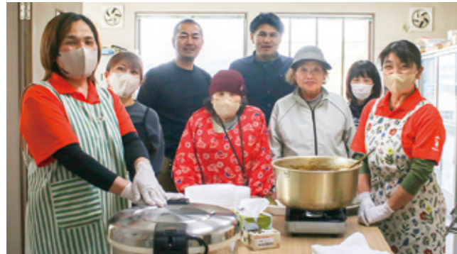
相良村商工会関係者のみなさん