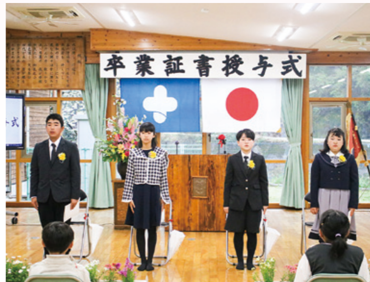
在校生へ言葉を贈る(北小)

3月23日(木)、南小学校と北小学校で卒業式が行われました。 南小では、男子11名・女子7名の計18名。北小では、男子1名・女子3名の計4名が小学校を卒業しました。 北小学校では、校長先生から卒業証書を受け取ったあと、卒業生から両親に卒業証書を手渡し、「今までありがとう」「これから迷惑かけてごめんね」「これからもよろしくお願いします」など感謝を伝えました。