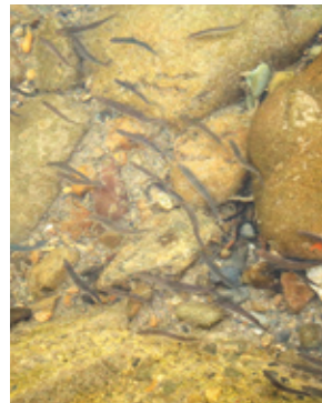
勢いよく泳ぎだす遡上アユ