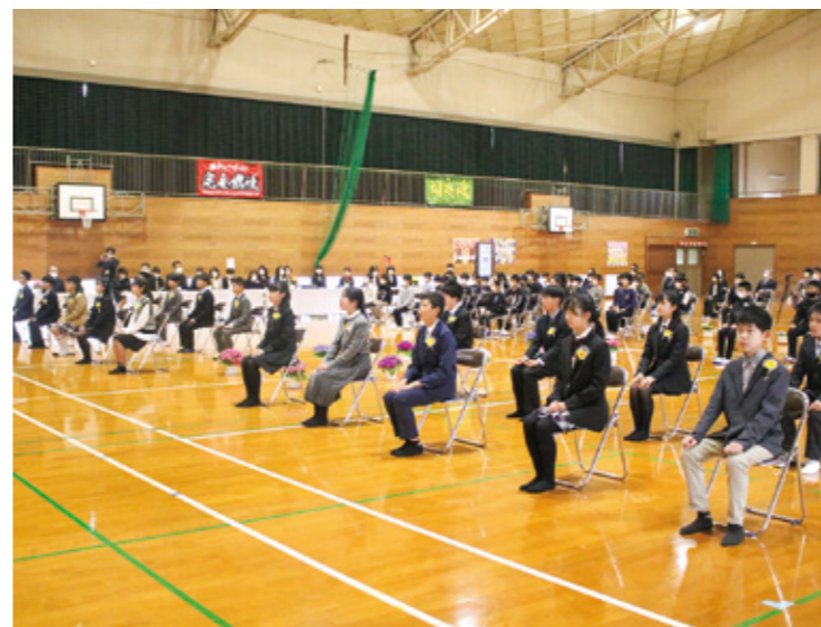
6年間の学び舎を巣立つ卒業生(南小)