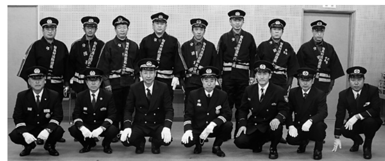
年末特別警戒出発の様子