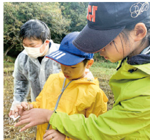
生息している動物を確認する様子