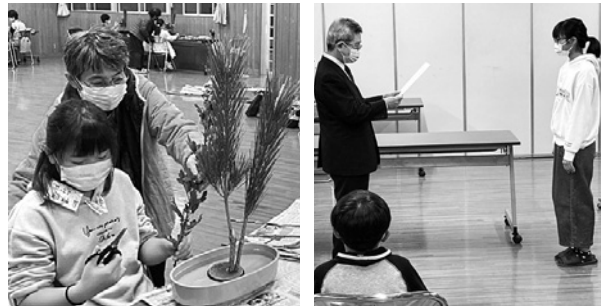
花をいける受講生たち