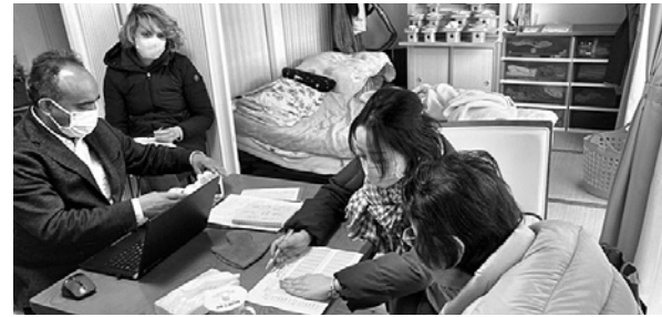
松葉団地での調査の様子

8月に仮設住宅を譲り受け、村有住宅として活用している松葉団地で12月1日から1週間、大学の研究機関による住環境調査が行われました。