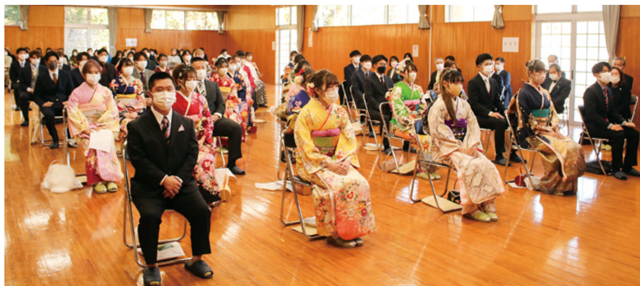
晴れ着に身を包む参加者