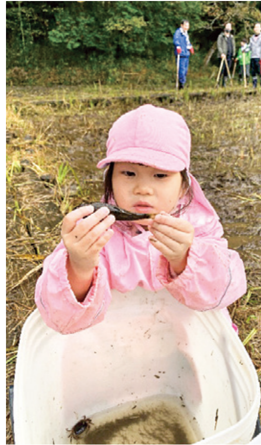
サワガニやザリガニ、ドングリなどの生き物に目を輝かせる子ども