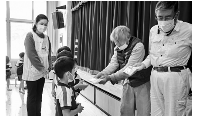
復興米を手渡される園児たち