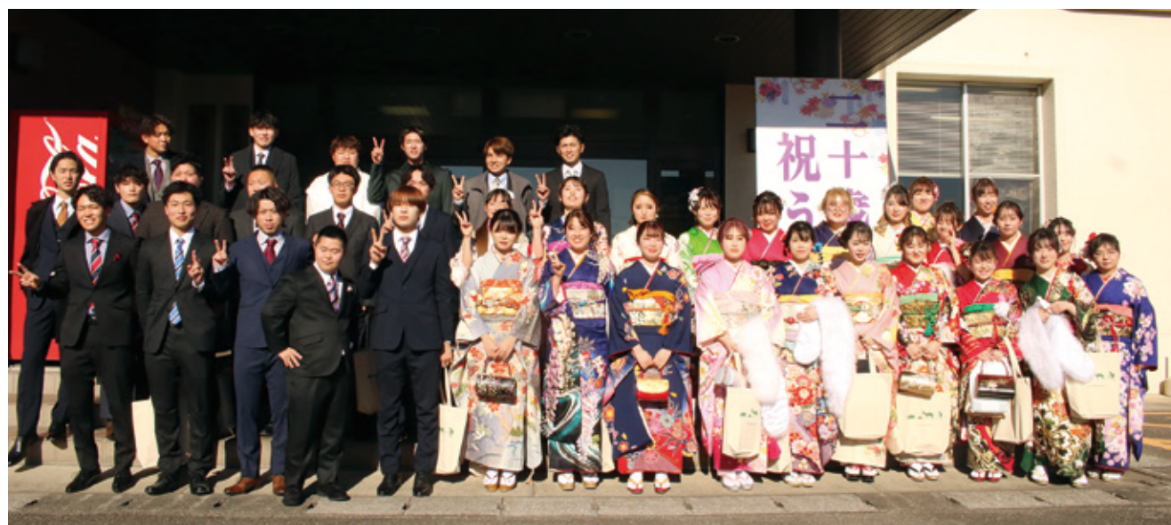
参加したみなさんで集合写真