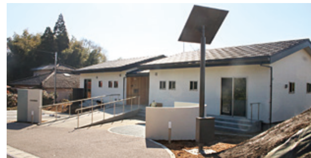
完成した西原団地