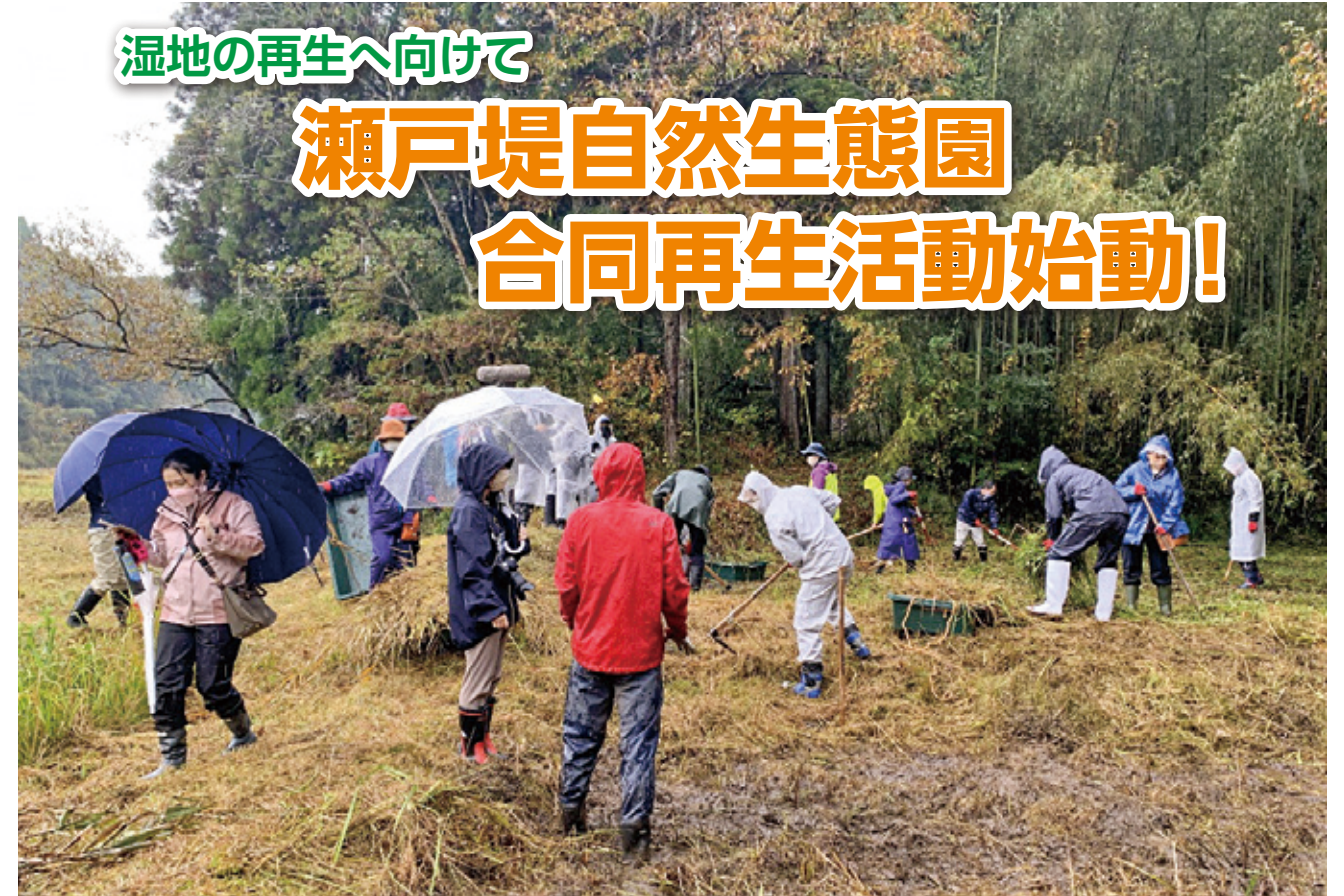
生態園内の田で耕作を行う参加者たち