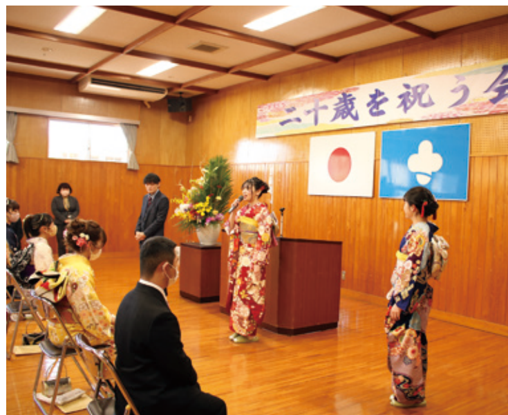
二十歳の決意を披露