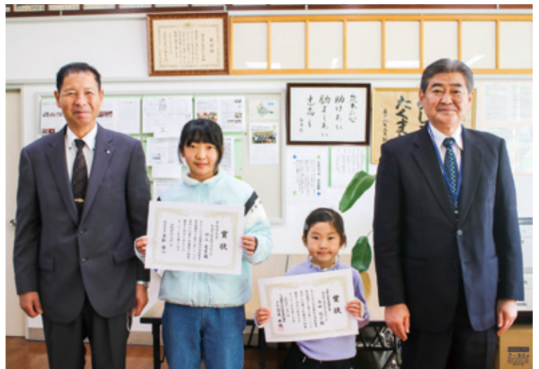
南小校長室での1枚