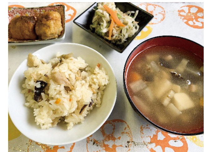
四浦和紙のランチョンマットで郷土料理をいただく