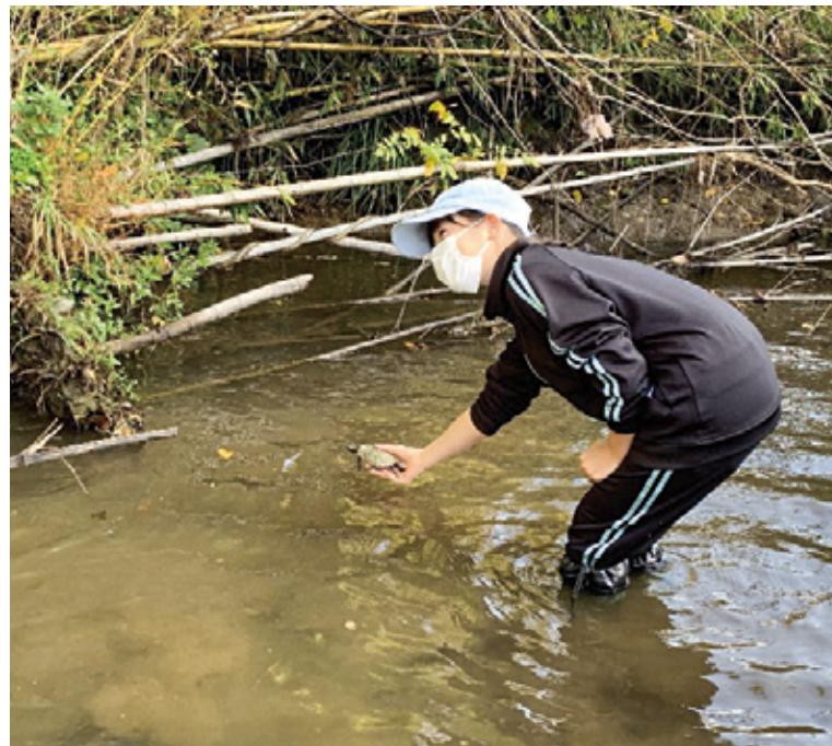
調査後のイシガメを選ず参加者