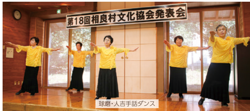
球磨・人吉手話ダンス