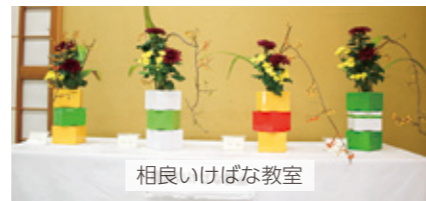
相良いけばな教室