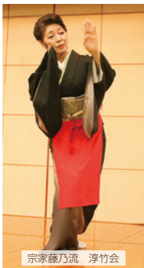
宗家藤乃流 淳竹会