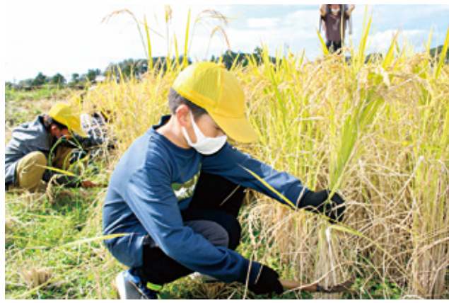
一つ一つ丁寧に稲を刈り取る児童たち