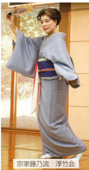
宗家藤乃流 淳竹会