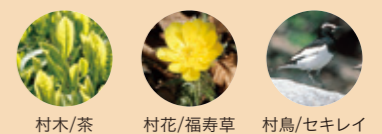
村木/茶 村花/福寿草 村鳥/セキレイ

相良村 面積:94.54km 2 世帯数 1,575世帯 (-9) 男性 1,948人 (-6) 女性 2,143人 (-19) 計 4,091人 (-13) ( )内は、先月末との差 ※外国人住民を含めた集計です。