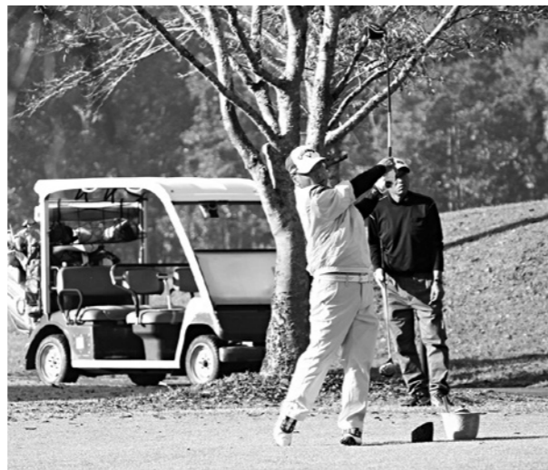
豪快なスイングでナイスショット

球磨郡民体育祭最終競技のゴルフ競技が、10月29日(土)あさぎり町の熊本クラウンゴルフ倶楽部で行われ、本村から5チーム19名が出場しました。 成績は、一般の部4位、50歳の部4位、60歳の部3位、70歳の部2位、女子の部4位、総合成績は5位でした。