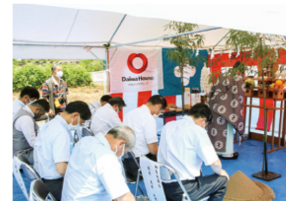
安全祈願祭の様子