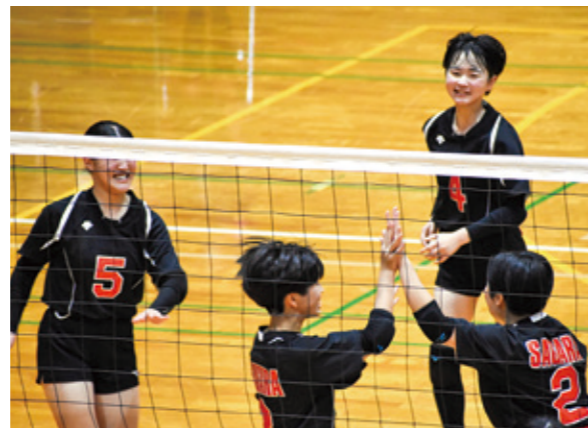
女子バレーボール