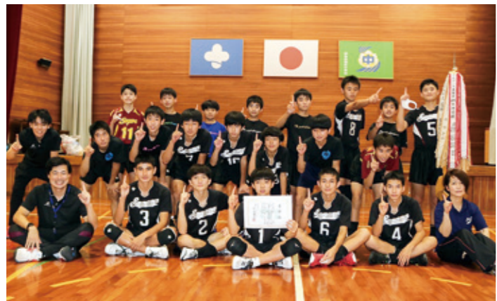
男子バレーボール