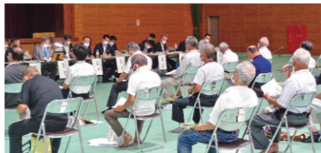
村民の方からの意見や要望の様子