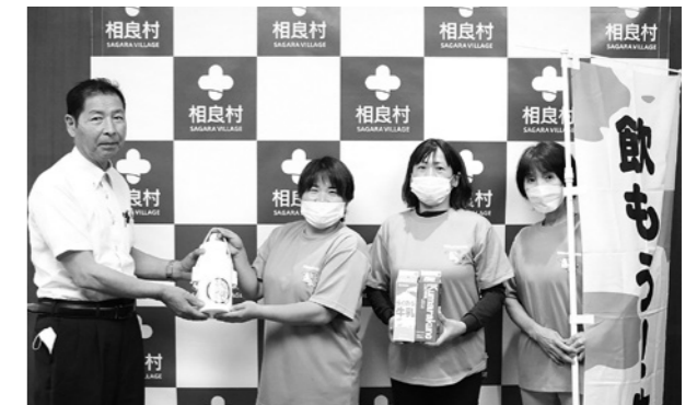
牛乳を贈ってくださった女性部の方々

地元で生産された牛乳の消費拡大を推進するため、球磨酪農農業協同組合女性部から牛乳が贈られました。人吉・球磨地域は、酪農家約100戸が乳牛約5000頭を飼養。生乳生産量は年間約4万トンで、県内有数の牛乳の産地です。