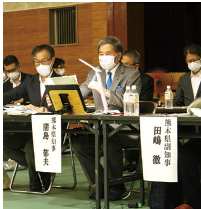
蒲島熊本県知事からの説明