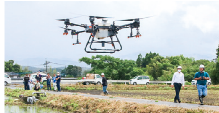
飛行するドローン