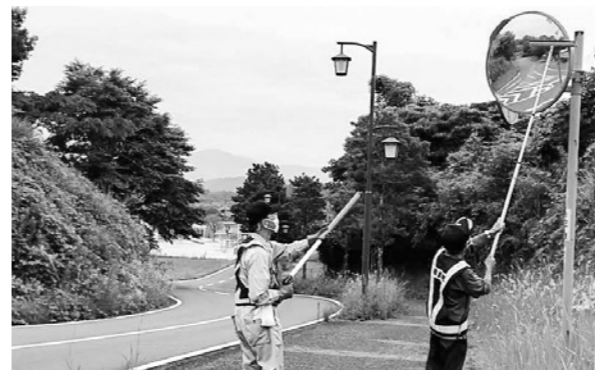
カーブミラーを磨き上げる交通指導員