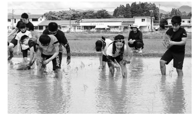
苗を植え始める児童たち

J A くま青壮年部相良支部の協力のもと、南小5年生36名が、食べ物作りの大変さと大切さを学ぶ食育の一環として、もち米の田植え体験を行いました。植えた苗は、児童たちが種をまき、水を与えて大切に育てたものです。