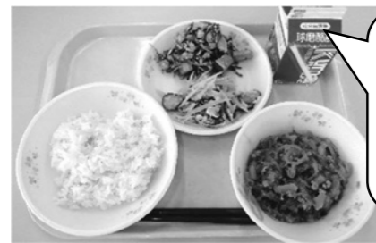
6月6日 根菜や豆、小魚などを使った カミカミメニュー