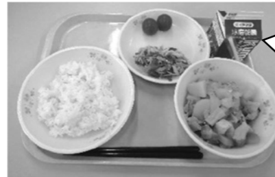
6月14日 野菜たっぷりの ビタミンたっぷり メニュー