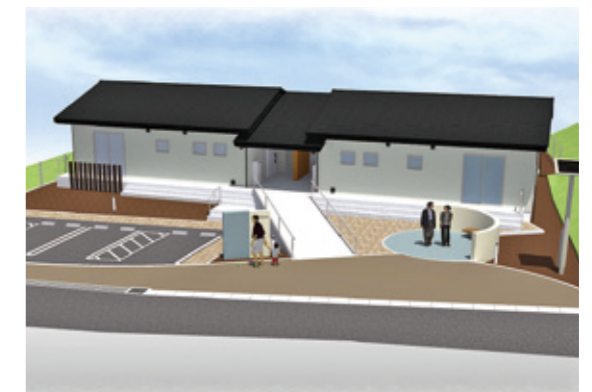
住宅のイメージ図

6月7日(火)に令和2年7月豪雨において県内で初めてとなる、村整備の買取型災害公営住宅の安全祈願祭が行われ、関係者およそ20名が出席しました。