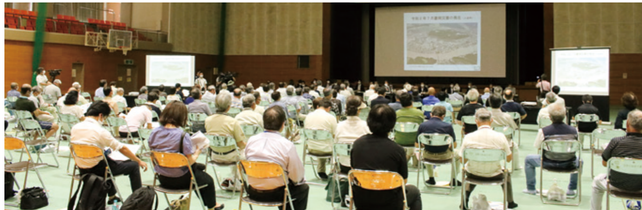
村民説明会の様子