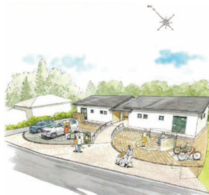
西原地区災害公営住宅イメージ図

整備場所は深水西原地区の村有地(さがら温泉茶湯里前)で、木造平屋建てを2戸計画しています。現在設計作業を行っており、令和4年度中の完成を目指しています。