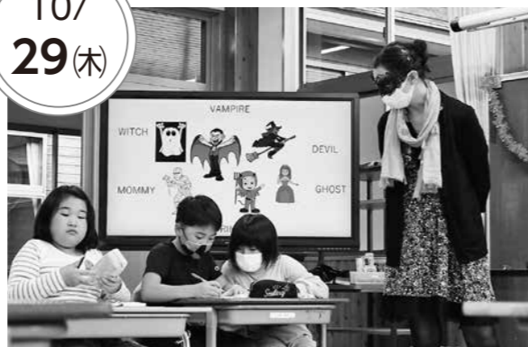
和気あいあいと授業が進められる