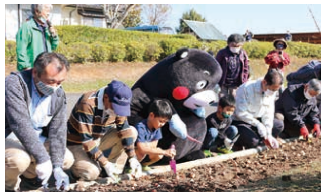
① 被災者の皆さんがくまモンと一緒に、茶湯里の駐車場横の花壇に植栽されました