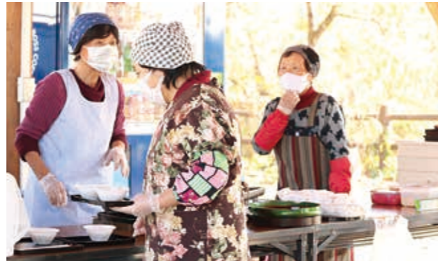
⑤ 150食分の炊き出しと、赤井区の皆さんにお土産として、相良茶とくりなりまんじゅうが準備されました