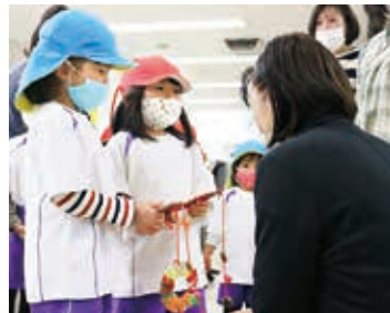
四浦保育所あざみ園