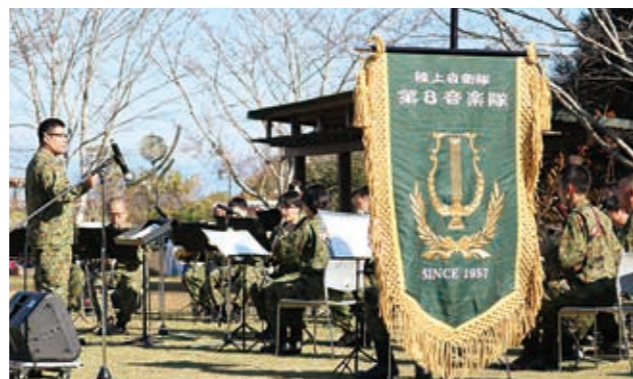
⑥ J-BEST (日本を勇気づける名曲たち)の中から「世界に1つだけの花」などが演奏されました