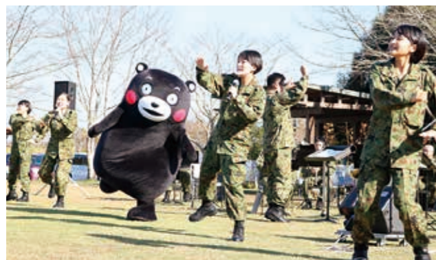
③ 陸上自衛隊北熊本駐屯地第8音楽隊の方と一緒にくまもとサプライズをダンス♪