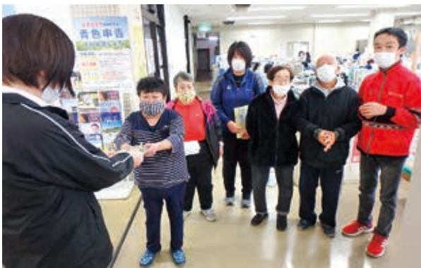
社会福祉法人ひまわり会あさひが丘からクリスマスの贈り物が保健福祉課長に手渡されました