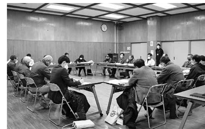
第2回策定委員会の様子