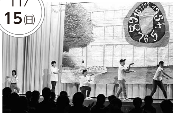
ラストのダンスシーン