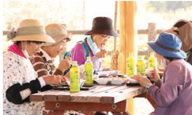
④ “相良の秋の収穫祭”に「おいしいね〜」と笑みがこぼれる益城町赤井区の皆さん