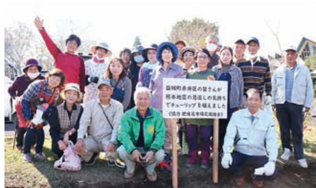
② 「きれいな花が咲きますように」と想いを込めて