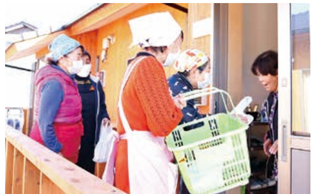
相良村婦人会から仮設住宅24戸にお餅と花が配られました