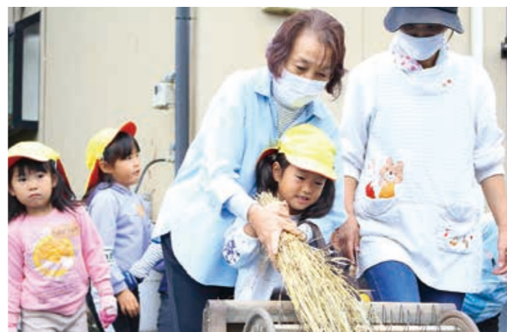
一人ずつ脱穀作業を体験