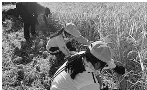
小型の鎌で一心に手刈りを行う児童たち

食べ物作りの大変さと大切さを学ぶ食育教育の一環として、毎年南小で行われているもち米栽培。5年生18名が総合的な学習の時間に、松葉地区の田んぼでは初めての稲刈りを行いました。