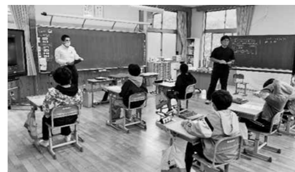
真剣に耳を傾ける児童たち

役場税務課職員が北小で租税教室を開催し、DVDなどを使い、5・6年生6人に税の使われ方や税金の大切さについて説明しました。職員が、「税金は安心・安全で、豊かな暮らしをするための社会を支える会費のようなものだと思ってください」と話すと、児童たちからは「税金が約50種類あることを知ってびっくりした」「一億円を初めて持ち、重さにびっくりした。村ではこれが3個と少しのお金が入っている。たくさんのお金が使われ、生活が便利になるので税金が大切だと思った」などの感想が聞かれました。