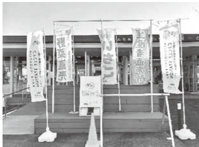
ふれあい交流センター「湯〜とぴあ」