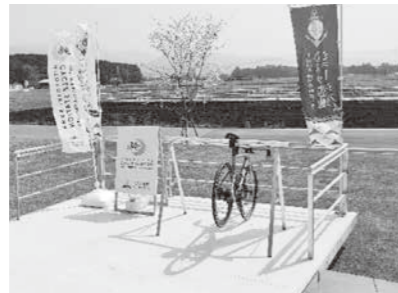
人吉海軍航空基地資料館 (ひみつ基地ミュージアム)