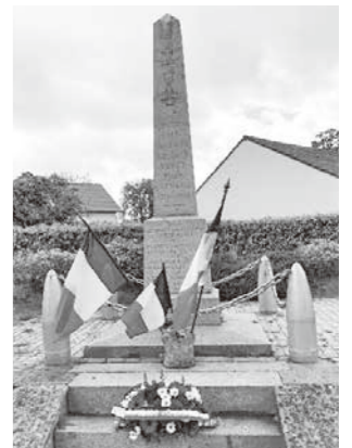
8日、ある村の慰霊碑

それで多くのフランス人は5月が好きです。特に学校で、そもそも休みが多くて、祝日は火曜か木曜になると、よく、学校は月曜か木曜を休みにします。だから5月になると喜んでる生徒が多いですが、今年はコロナウイルスであまり家から出られなくなって、5月はそんなに楽しめないかもしれません。