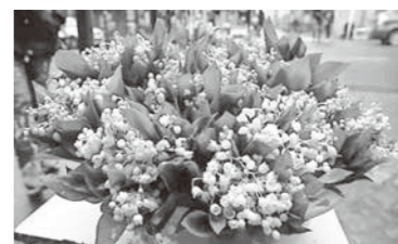
Le muguet スズラン